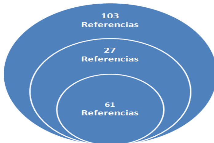
Ilustración 1: Modelo de Bradford para mostrar la dispersión de las referencias a partir de los autores más referenciados (fuente: elaboración propia).

La zona 1 o núcleo cuenta con 61 referencias, esto es debido a que los valores posteriores exceden a 64, que es la división del total de 192 referencias a representar. La zona 2 cuenta con 27 referencias y la zona 3 o periférica cuenta con 104 referencias, la misma representa todos los autores que tienen dos referencias y los autores transitorios.