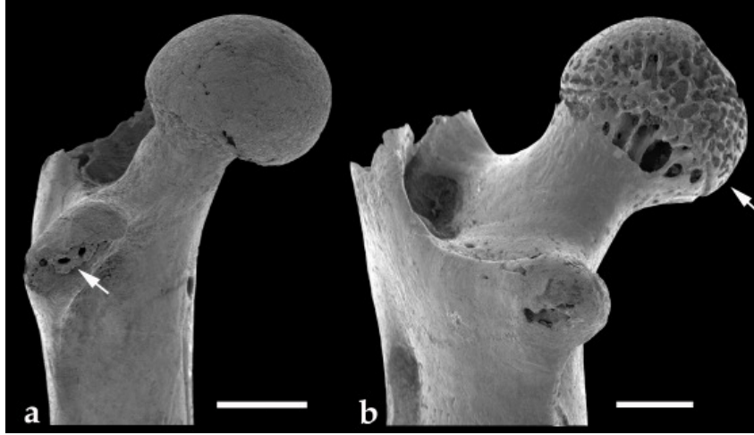
Figura 2. Elementos postcraneales con evidencias de corrosión digestiva: a) fémur de Sigmodontinae con corrosión ligera (Componente I, Nivel 6); b) fémur de Caviinae con corrosión moderada (Componente II, Nivel 14). Escalas: 1 mm.

El 93,7% de todos los especímenes recuperados de ACA-1 estaban fracturados (Componente I = 96,1%; Componente II = 91,5%). No se recuperaron cráneos completos; correspondiendo a maxilares sin arcos zigomáticos y a fragmentos de premaxilares. En ambos componentes se registraron ca. del 50% de pérdidas dentarias. Las mandíbulas se encontraron muy fragmentadas, recuperándose una sola completa en el Componente II. La mayoría de los molares e incisivos se hallaron enteros. Sólo el 25% de los húmeros, fémures y tibias estaban completos. Los metapodios y falanges estaban enteros y se registró una vértebra fracturada. No obstante, los elementos más frágiles como las cinturas se encontraron fragmentados. Además, un 80% de los elementos postcraneales rotos recuperados de ambos componentes exhibieron superficies de fracturas con ángulos agudos y bordes ásperos. Por otra parte, no se encontraron esqueletos articulados de Ctenomys sp., que pudiera explicar una muerte natural en el sitio.