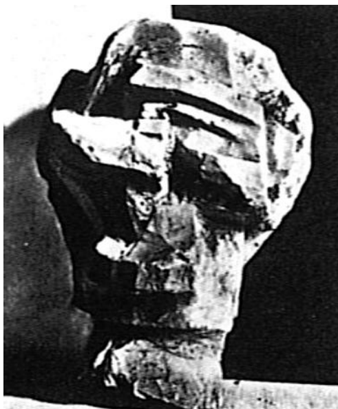
Figura 8. Picasso, Cabeza, estudio para una escultura , París, 1909. Cabeza , París, 1909. El dibujo superior, más que un proyecto determinado, es un estado de la serie de la que procede el bronce Cabeza de Fernand Olivier . La escultura de la ilustración inferior remite al mismo origen, superado el original en un estado avanzado de la aplicación.