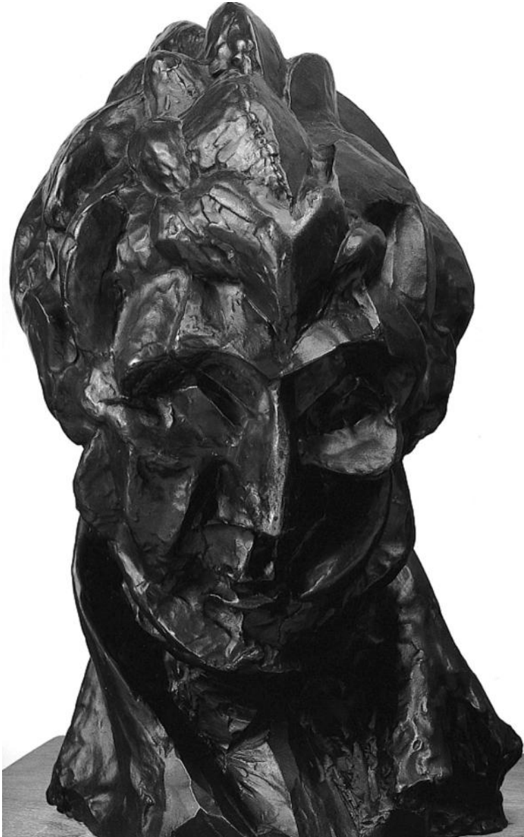
Figura 4. Picasso, Cabeza de Fernande Oliver , Horta de Ebro, 1909. Es el primer hito de la escultura cubista. La materialización del estado en la tercera dimensión le permitió organizar los volúmenes mediante la acción de planos y huecos complementarios.

Nueva interpretación del volumen facetado de las esculturas modeladas por Picasso en Horta de Ebro y París, en 1909