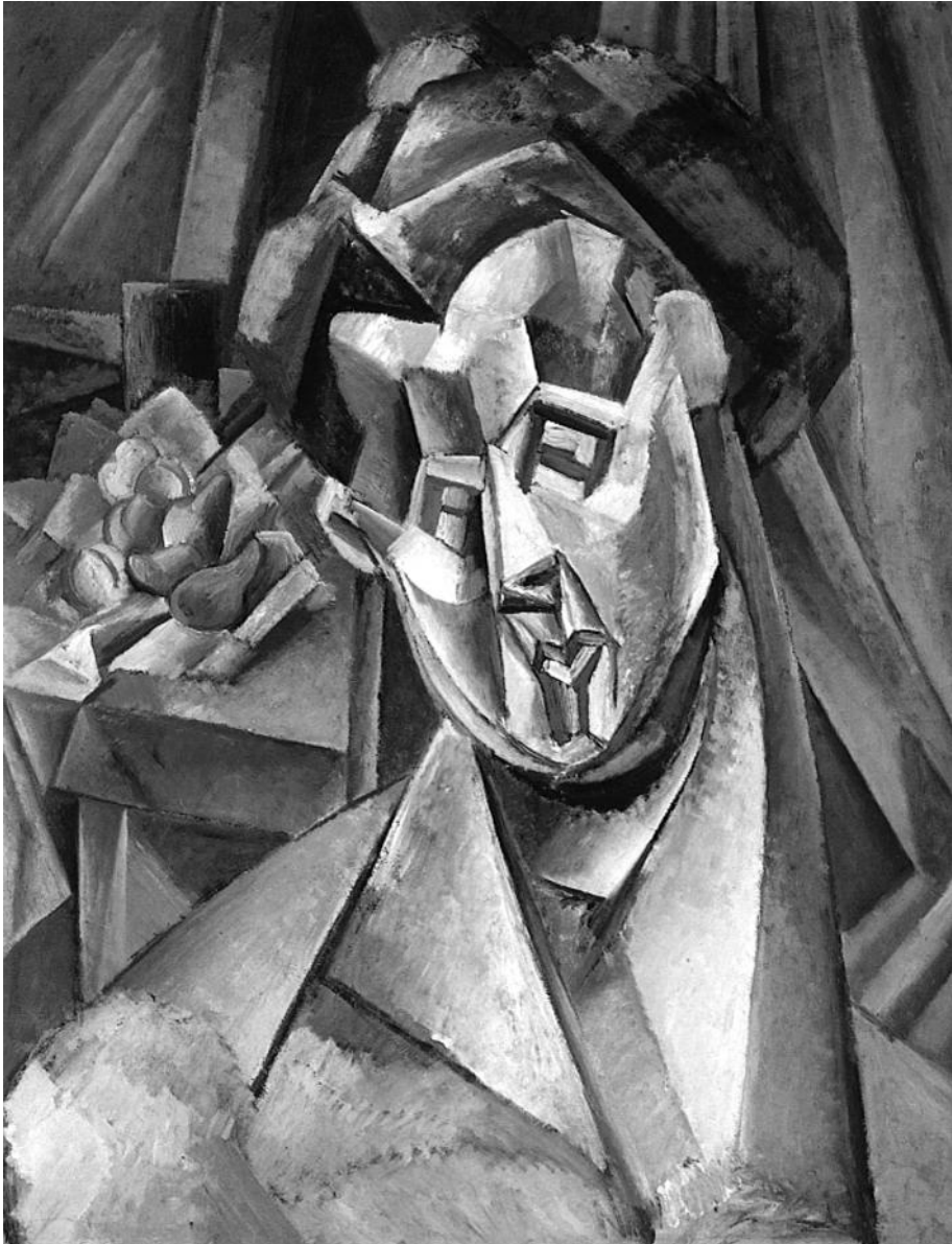
Figura 5. Picasso, Fernande Olivier con peras , Horta de Ebro, 1909. La escultura Cabeza de Fernande Olivier fue la referencia para la interpretación de una serie de pinturas, entre las que destaca ésta, que mantiene la poderosa presencia física y la fuerza expresiva del original.