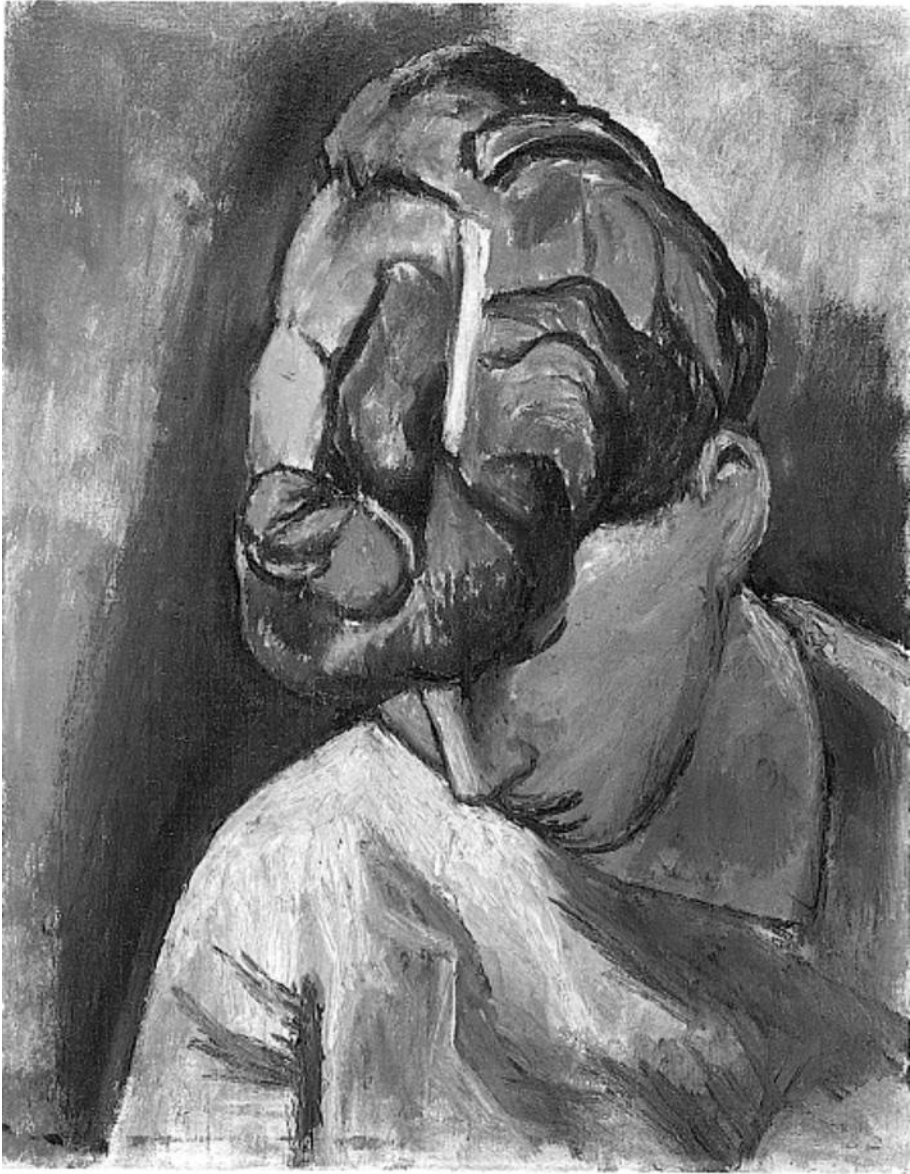
Figura 3. Picasso, Cabeza inclinada , París, 1906. La organización del pelo mediante grandes masas, simplificadas y convenientemente perfiladas, produce un efecto racionalizado que no llega a la alternancia de planos cubista debido al volumen propiciado por el dibujo de los perfiles, las diferencias tonales y los contrastes lumínicos.