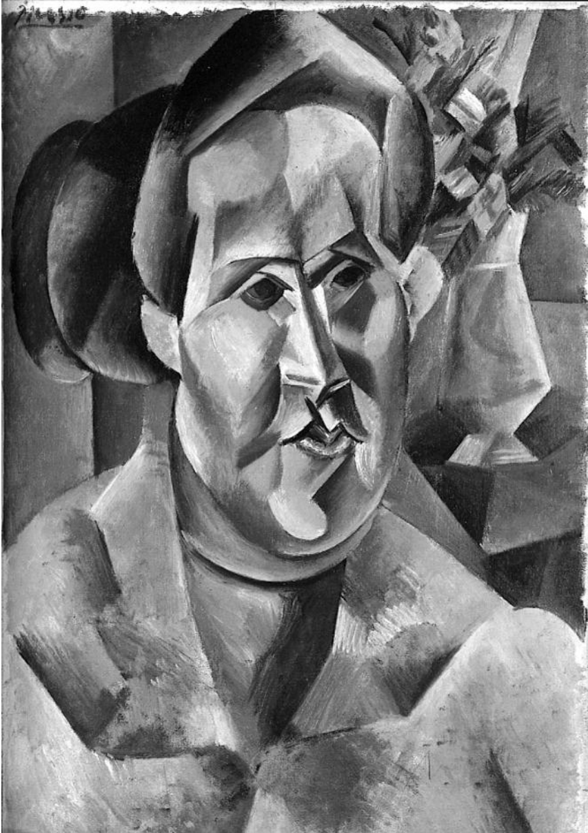
Figura 7. Picasso, Busto de Fernande Olivier con ramos de flores, Horta de Ebro, 1909. Picasso superó la referencia de la escultura Cabeza de Fernande Olivier con estados en los que mantuvo las claves estéticas.