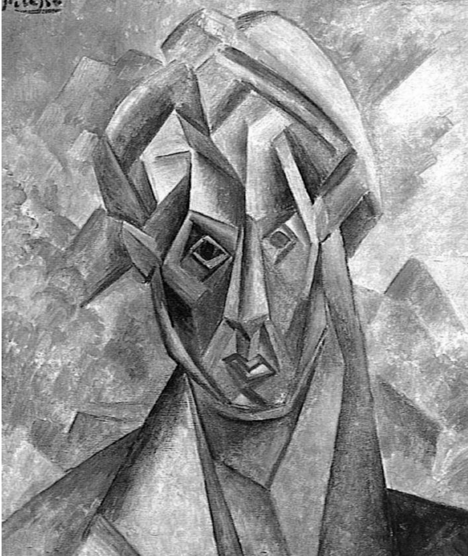
Figura 6. Picasso, Cabeza de Fernande Olivier ante un fondo de montañas , Horta de Ebro, 1909. Es otra de las pinturas que proceden de la referencia aportada por la escultura que Picasso modeló el mismo año en París.

Nueva interpretación del volumen facetado de las esculturas modeladas por Picasso en Horta de Ebro y París, en 1909