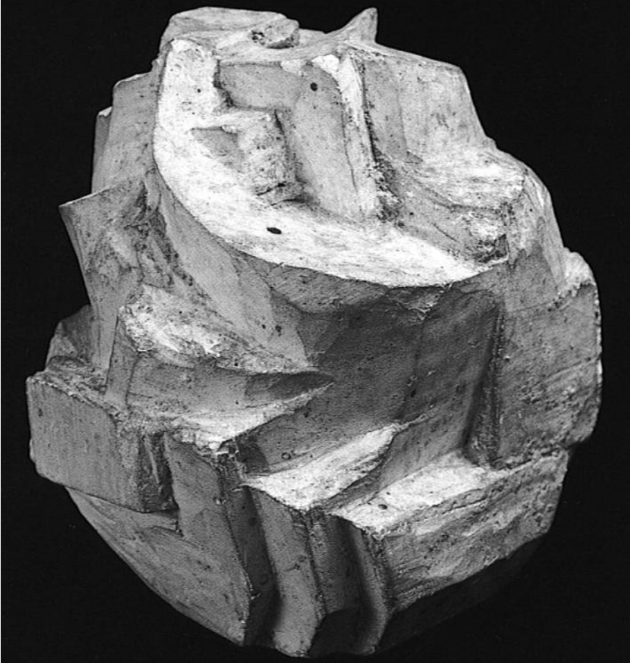
Figura 9. Picasso, Manzana , París, 1909. La proyección analítica de esta escultura corresponde a la tercera fase; mas los ritmos plásticos, sin correspondencia explícita con la realidad, anticipan la abstracción de la sexta.