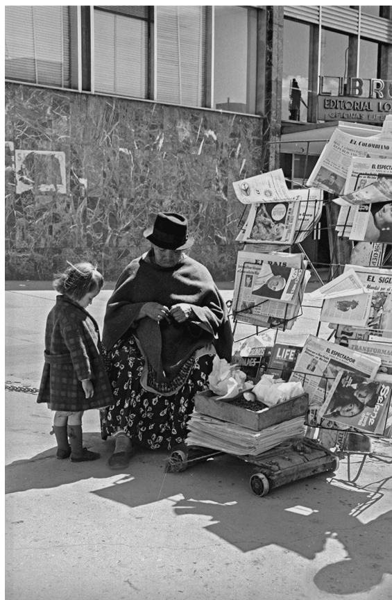
Hernán Díaz Vendedores ambulantes de prensa. Bogotá, Colombia Circa 1970

Dentro de la paternidad, Cadoret (2003, citado por Hace 2006) menciona estrategias como: una pareja o individuo gay insemina a una mujer, para que esta cumpla con la gestación, y una vez nacido el hijo les sea entregado; o niños que son gestados por medio de la co-paternidad, es decir, que dos parejas: una de gays y otra de lesbianas se alían para concebir, educar y cuidar a un bebé. Uno de los hombres será el padre biológico, mientras que una de las mujeres será la madre biológica, con la participación de las respectivas parejas desempeñando roles parentales. Una estrategia posible para hombres y mujeres consiste en que una pareja o individuos solteros se hagan cargo de niños desvalidos, que pueden ser hijos de algún familiar o de madres y padres desconocidos.