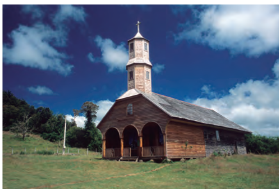
Figura 2 Iglesia de Colo antes (arriba) y después (abajo) de la restauración.