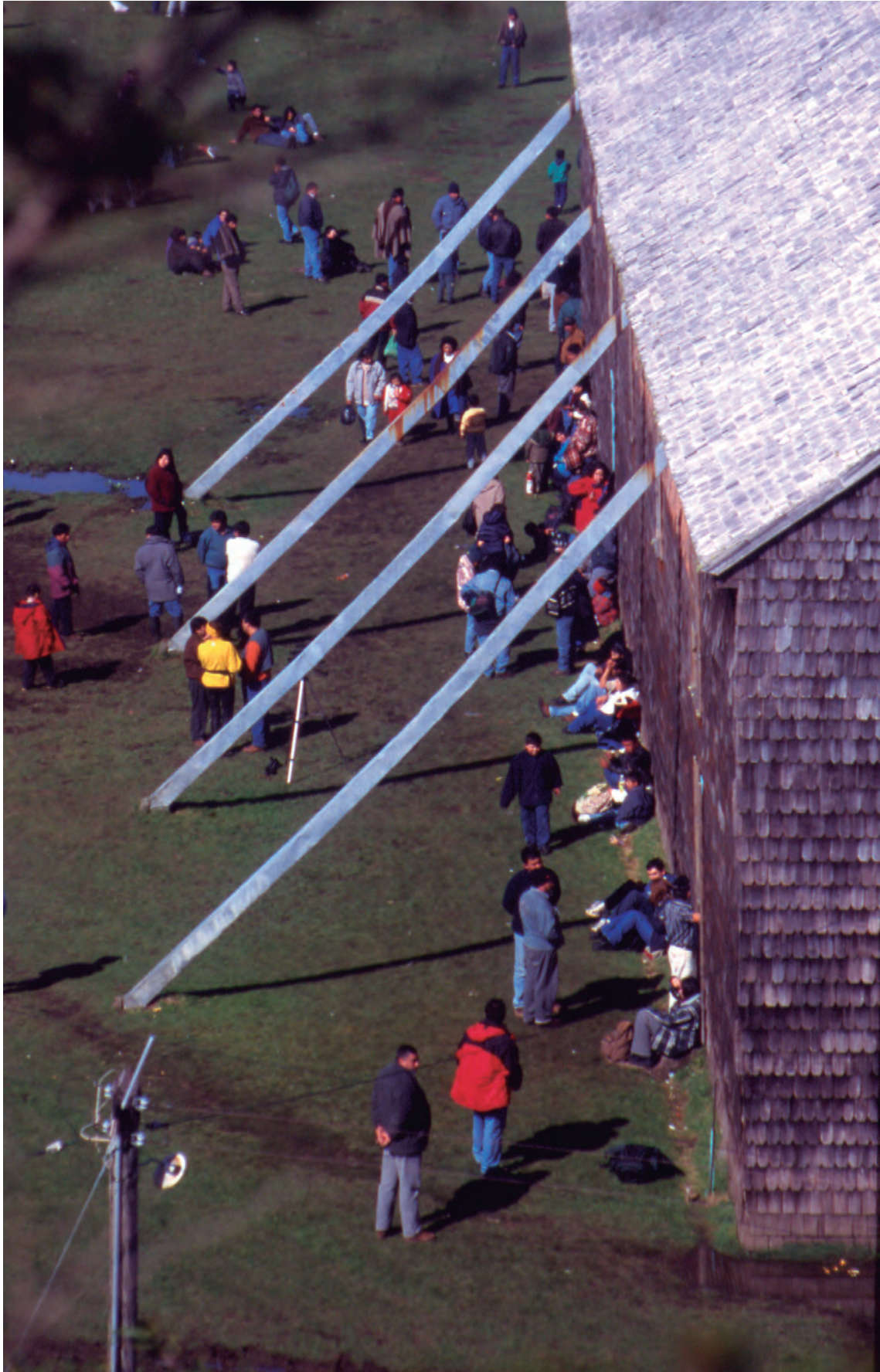
Figura 0 Turistas y creyentes en la iglesia de Caguach.