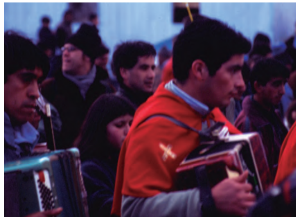
Figura 4 Fiesta del Nazareno de Caguach.