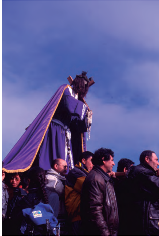
Figura 1 La fiesta Nazareno de Caguach.