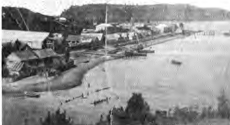
3 Quemchi a comienzos de siglo (probablemente 1915). Ya es notorio el crecimiento del pueblo. Se han construido 2 muelles y las casas enriquecen su volumetría, incorporando los clásicos miradores.

El proceso urbanizador y arquitectónico, que comenzó tardíamente a fines del siglo XIX, configuró un cuadro urbano de fachadas continuas delimitando de esta manera espacios públicos de gran "encerramiento" e interioridad. Las alturas de las edificaciones muy similares superada sólo por la torre de la iglesia. En la arquitectura algunos elementos fueron significando una manera particular de usar el espacio, como el acceso en ochavo para los comercios y los miradores en las viviendas. También fue el espacio enriquecido visualmente por el tratamiento expresivo de la madera y el ornamento de las planchas de zinc utilizadas como forros protectores. Junto con los corredores hacia la calle y la ornamentación