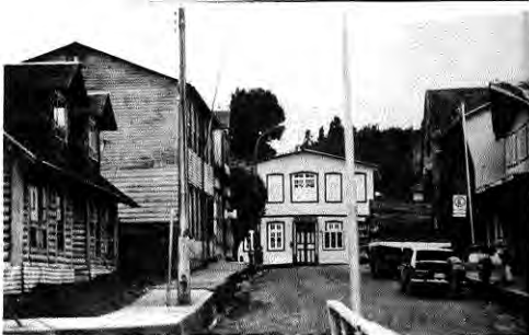
Antiguas construcciones de madera conforman el espacio de la llegada del bus.