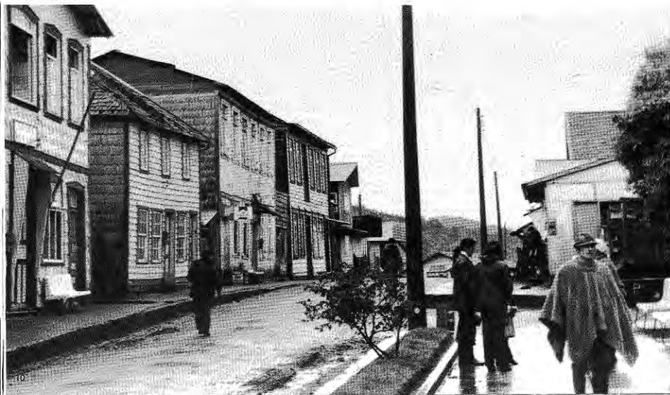
Quemchi, vista parcial.