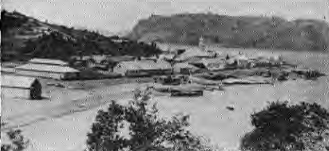
2 Quemchi a comienzos de siglo (probablemente 1905). La esbelta torre de la antigua iglesia se destaca entre austeras y simples construcciones de madera. Nótese la ausencia de miradores.

Es entonces la mano de un inglés inmigrante la que configura con sentido práctico la estructura básica del pueblo. En este trazado se sigue la línea del borde costero que se establece como eje urbano primordial. Hacia el interior se conforman grandes manzanas rectangulares y en ellas las calles siguen las irregularidades topográficas de los cerros cercanos. La Plaza de Armas aparece reducida a una mínima expresión y no corresponde al esquema de la plaza jerárquica y central tan común en los esquemas fundacionales hispánicos. Todo lo cual contribuye a que este caso en particular se distancie un poco de la imagen tradicional de poblados como Achao, Curauco de Vélez y tantos otros. En realidad no podía ser de otra forma. Quemchi es un pueblo de origen reciente, que no posee la tradición hispánica de la mayoría de los asentamientos en Chile.