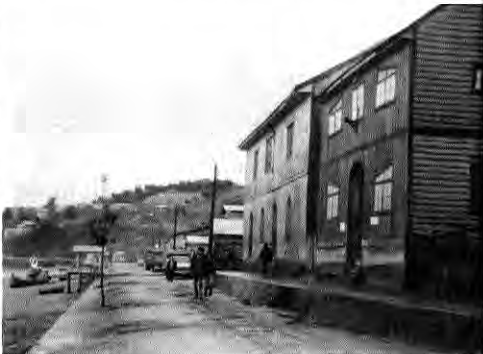
Calle costanera. Se observa aquí la ex oficina de Langdom; antigua construcción de albañilería de piedra canchagua.