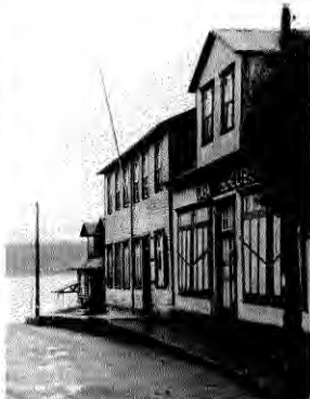
Ex hotel Alemán — hoy vivienda— junto a la ex casa Scholbach, en Quemchi.

Hotel Alemán de Quemchi, hacia 1910. Las construcciones que lo rodean hoy han desaparecido, pero el antiguo hotel sobrevive.