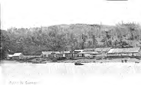
1 Postal de Quemchi, probablemente de fines del siglo XIX. La impronta maderera del pueblo es visible en estas primeras construcciones.