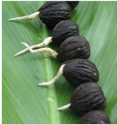
Figura 2. Semillas de Juglans jamaicensis germinadas, mostrando la ubicación y apariencia de la radícula.

En la figura 2 se muestra una secuencia de emergencia de la radícula del nogal del país en el germinador como parte de la ocurrencia de la tercera etapa del proceso germinativo y como muestra de la primera manifestación de una germinación exitosa.