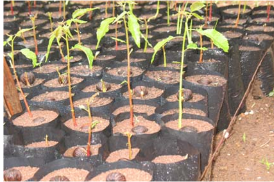
Figura 4. Vista del comportamiento hipogeo de la germinación.

En el trasplante hacia las bolsas de polietileno negro se alcanzó un 99,3% de supervivencia de las plántulas, demostrándose la efectividad del trasplante en el vivero en esta especie, sin embargo Álvarez, Castillo y Hechavarría (2006) encontraron una supervivencia menor (77%) al realizar el trasplante a los 80 días.