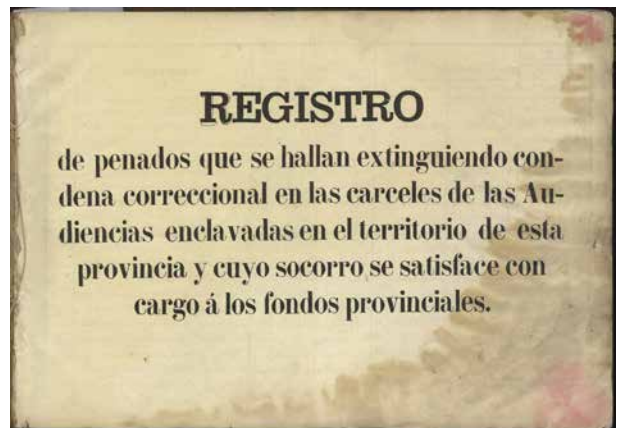
Foto 1. Portadilla del registro de penados (Años 1886-1910).

Este trabajo se ha realizado sobre la documentación existente en el fondo archivístico de la Diputación Provincial de Murcia, por lo que las fechas extremas abarcan de 1886 a 1925. El análisis se ha centrado principalmente en dos series específicas, como son “Expedientes de presupuestos carcelarios” y “Expedientes de cuentas carcelarias”. Como documentación complementaria dentro del fondo de la Diputación se conservan los Partes diarios de ingreso y salida de procesados a disposición de la Audiencia y sentenciados a prisión correccional a efectos de pago de socorro por la diputación provincial (1893-1895), y el Registro de penados que se encuentran extinguiendo condena correccional en las cárceles de las audiencias enclavadas en el territorio de esta provincia y cuyo socorro se satisface con cargo a los fondos provinciales (1886-