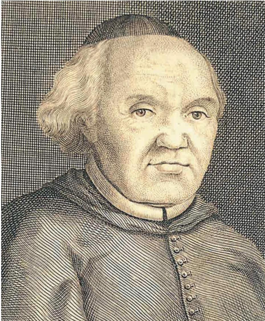
Fig. 2. Retrato del Cardenal don Andrés de Orbe y Larreátegui (Biblioteca Nacional, Colección Cardenera, Iconografía Hispana)