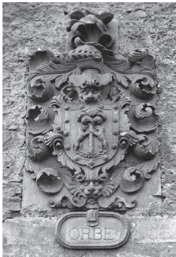
Fig. 1. Escudo de armas de la familia Orbe en la casa solar de Anguiozar, Guipúzcoa

La familia Orbe antedicha tiene su origen histórico en el caserío de Anguiozar, entonces perteneciente a Elgueta y más tarde a la villa de Vergara, Guipúzcoa, donde aún subsiste la casa solar de Orbe con el siguiente escudo de armas esculpido en su fachada: en campo de oro un pino con dos lobos empinados y bordura roja con trece besantes de oro (3).