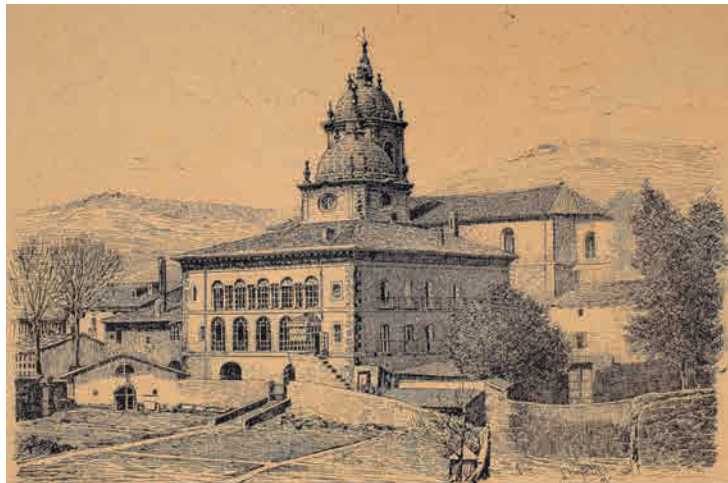
Fig. 4. Palacio del Marqués de Valdespina en Ermua, Vizcaya ( El Estandarte Real. Revista Político-Militar Ilustrada , año II, nº 21, Barcelona, 1890)