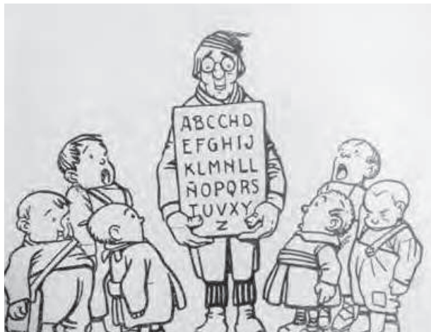
Imatge 4: El mestre humà realitzat per Cornet per a: CREHUET, Pompeu: Senyor Ruch, mestre d'estudi , Barcelona, Baguñà, 1908.