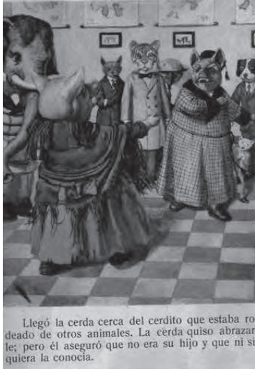
Imatge 2: Il·lustració en que podem veure al protagonista de La cerda y el cerdito (1940) renegant de la seva pròpia mare.

D'altra banda, trobem una característica comuna entre aquests mestres dels que no en destaca especialment la idealitat: són personatges clau pel pretext narratiu de l'obra que, en la majoria dels casos analitzats, és humorístic. Un de les exemples més emblemàtics és, sens dubte, Senyor Ruch, mestre d'estudi (1908). En ella se'ns relata les desafortunades, alhora que còmiques, aventures d'un ruc que vol emular al seu amo i fer de mestre. L'atzar el porta a un poble on, casualment, n'estaven esperant un i com que ell ja s'havia preocupat d'aconseguir una indumentària adequada, passa desapercebut i assumeix el càrrec fins que les seves bestieses, i el retorn a casa, li fan evident la gran veritat de la història: «Aquest abrich y aquestes ulleres y aquet barret que