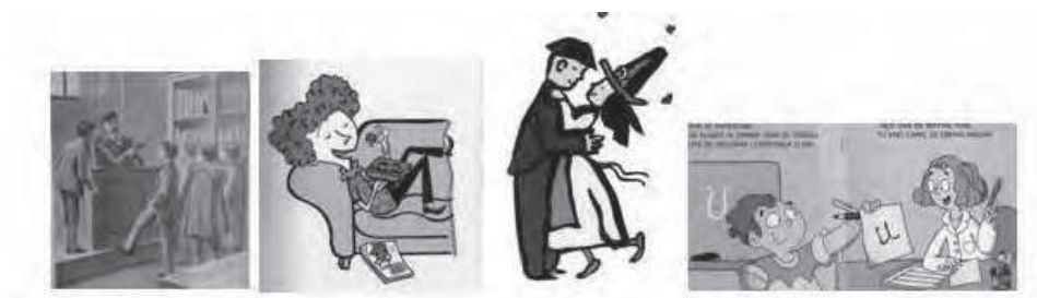
Imatge 1: D'esquerra a dreta: El protagonista de Viaje alrededor de la clase (1909): La mestra Flo en un moment relaxat imaginada per l'alumne protagonista a La mestra Flo no sap ni la O (2014); La bruixa i el mestre (2001) i La mestra Esperança (2004).

Els mestres més propers a aquest concepte d'idealitat serien, sense dubte, els 9 personatges de Cuore (1886), el protagonista de Viaje alrededor de la clase (1909), el de Fiestas escolares (1948), Nicómedes Peribáñez, protagonista de El maestro y el robot (1983), A la sombra del maestro (1995) i Amalia Zapatero, protagonista de La profesora que feia faltes d'ortografia (2014). Després segueixen alguns mestres que, tot i que la trama narrativa