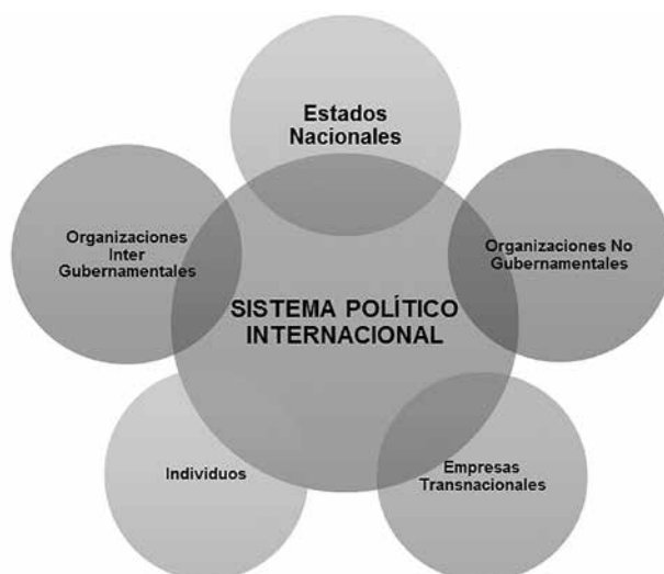
Gráfico 1. Actores del sistema político internacional contemporáneo. (Elaboración propia).

Estos cinco actores, decisores del poder mundial 2 , mantienen una relación de interdependencia y necesidad mutua, puesto que el grueso de sus objeti-