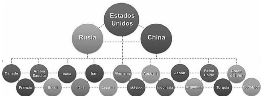
Gráfico 2. Jerarquía de los 21 Estados principales del sistema internacional*