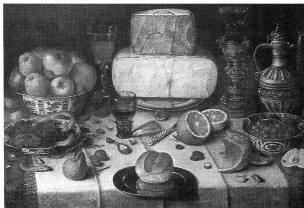
Naturaleza muerta del pintor holandés Floris Dijk

La imagen pictórica, por el contrario, puede fingir una realidad sin correlato.