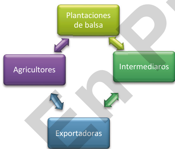
Figura 1: Tipos de productores de balsa para la exportación

Por otro lado en función del nivel de participación en las actividades relacionadas con el aprovechamiento de madera aserrada, ya sea dura o blanda, en la zona de producción se han identificado los siguientes agentes en la cadena de comercialización de madera aserrada: productor – aserrador / intermediario – comerciante transportista y depósito ya sea en el mercado local o fuera de la región, como se ilustra en la siguiente figura. (Donoso, 2012)