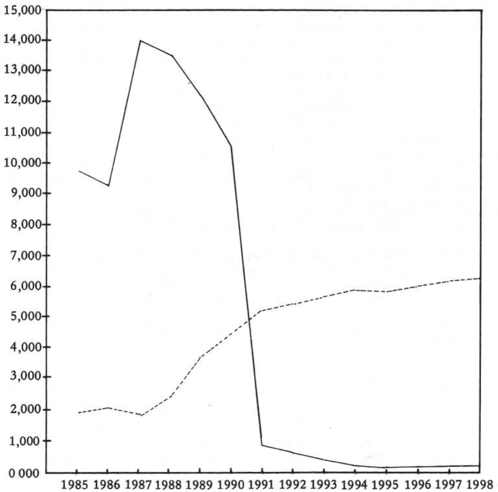
FIGURA 2. Perfil de pagos de capital de la deuda pública antes y después de la reestructuración 1984-1990. (Millones de dólares).