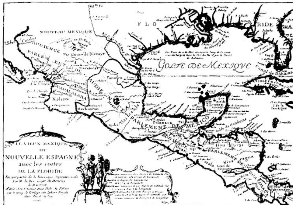
Figura 2. Mapa de Nicolás de Fer 1702.