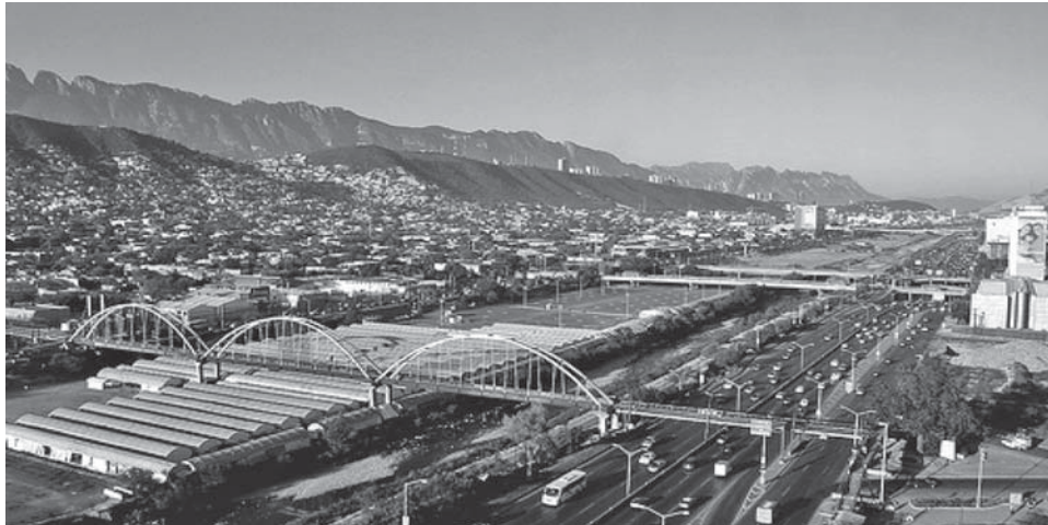
Foto 3. Vista aérea del Puente del Papa desde el Hotel Sheraton

Fuente: < http://www.flickr.com/photos/darijuss/3023230805 >. Fecha de consulta: enero de 2010.