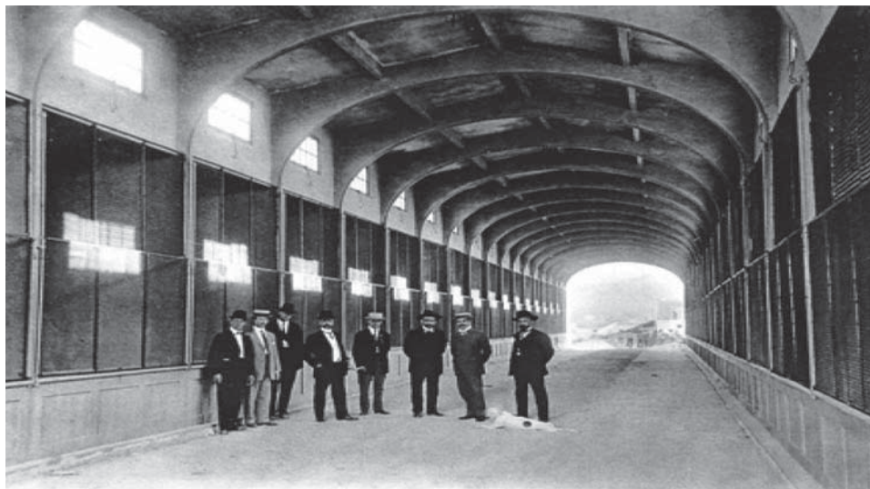
Foto 2. Vista del interior del puente de San Luisito en 1904