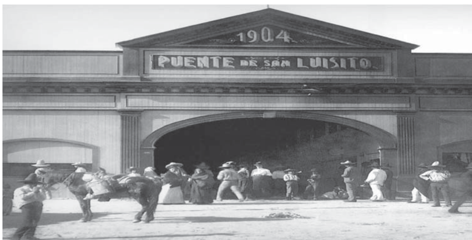
Foto 1. Puente de San Luisito en 1904, dañado severamente durante la inundación de 1909

En 1888, las autoridades decidieron reemplazar el puente por uno colgante que resultó deficiente y peligroso, por lo que los transeúntes preferían cruzarlo por debajo y los comerciantes a su vez, realizaban la vendimia a la sombra del mismo. Dos años después este puente fue sustituido por otro de madera, más resistente (foto 1) y tan ancho que daba paso a los tranvías y carretas jaladas por mulas que trasladaban a los visitantes hasta el santuario de la Virgen de Guadalupe. Como el puente era más ancho, un mayor número de comerciantes pudo establecerse. Esto provocó una mayor afluencia de gente de clases bajas que veían en este mercado un