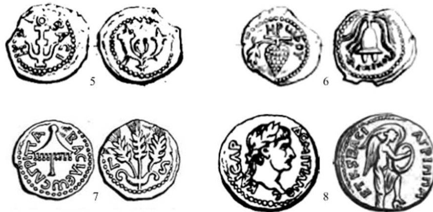
Fig. 3: Monedas Herodianas: 5 prutá de Herodes el Grande; 6 prutá de Arquelao; 7 prutá de Agripa I; 8 bronce de Agripa II

El tercer periodo incluye las monedas de bronce que acuñaron los distintos miembros de la dinastía herodiana (cf. fig. 3) que gobernaron, con permiso de los romanos, sobre algún territorio de Palestina entre el 37 a.C. y ca. 100 d.C.: Herodes el Grande, Herodes Arquelao, Herodes Antipas, Filippo, Agripa I y Agripa II. En estas monedas se aprecia un progresivo carácter grecorromano, que comienza con las representaciones de tipos más o menos respetuosos con el judaísmo en las monedas de Herodes el Grande y sus hijos Arquelao y Antipas, y pasa a la representación del emperador y sus familiares o de los gobernantes herodianos y los suyos, e incluso de deidades helenísticas en las monedas de Filippo, Agripa I y Agripa II. Las leyendas son casi siempre griegas, aunque en algún caso aparecen en latín.