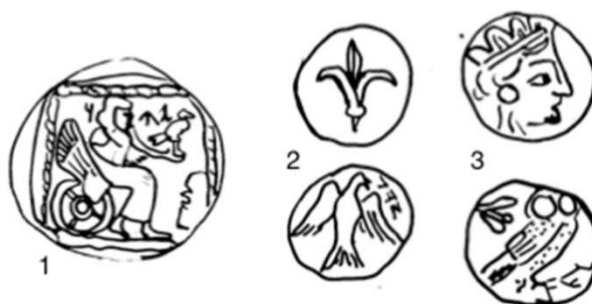
Fig. 1: Monedas Yehud: 1 dracma; 2 1/2 óbolo; 3 óbolo

Al primer periodo corresponden las monedas de plata que acuñaron, probablemente, las autoridades religiosas o civiles judías de Judea durante los ss. IV-III a.C., época de la dominación de los persas y los lágidas (cf. fig. 1). Estas monedas se caracterizan por llevar, la mayoría de ellas, el nombre de la provincia, Yehud, en caracteres paleohebreos 3 , y por imitar a las monedas de las principales potencias económicas y militares de la región, primero de Atenas, posteriormente del Imperio Persa y finalmente de los lágidas.