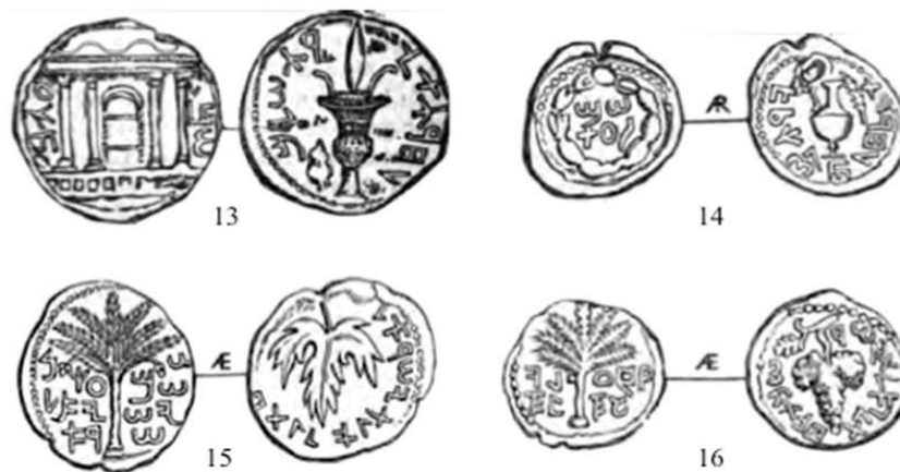
Fig. 5: Monedas Guerra de Bar Kojba: 13 shequel sin datar; 14 denario sin datar; 15 bronce mediano del año 1; 16 bronce pequeño del año 2.

Al último periodo pertenecen las monedas de la guerra de Bar Kojba, la segunda revuelta judía contra los romanos (cf. fig. 5). Los rebeldes judíos reacuñaron todas las monedas de plata y bronce que llegaron a sus manos, con tipos relacionados con el Templo de Jerusalén y la tradición judía, y con leyendas que proclamaban la libertad y redención del pueblo judío.