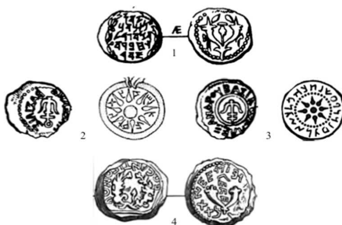
Fig. 2: Monedas Asmoneas: 1 prutá común; 2 prutá ligera; 3 prutá aramea; 4 bronce grande de Matatías Antígono.

El segundo periodo corresponde a las monedas de los asmoneos (c.f. fig. 2), la dinastía judía que, tras la revuelta macabea contra los seléucidas, instaló una monarquía independiente en Judea, en la segunda mitad del s. II a.C. Los gobernantes de esta dinastía acuñaron, hasta el 37 a.C., pequeñas monedas de bronce, en las que se representan símbolos tomados, principalmente, de las monedas seléucidas y se leen leyendas fundamentalmente en paleohebreo, pero también en arameo y griego, donde se menciona los nombres de los gobernantes asmoneos.