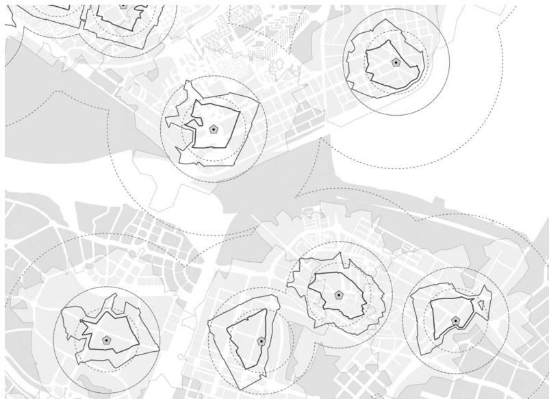
Fig. 3. Delimitación a través del viario del entorno de ciertos puntos de la red de TP de Madrid. Para evidenciar diferencias, se superpone la delimitación mediante distancia euclidiana.

Otro tipo de indicadores proponen la delimitación de entornos en relación a nodos de la red de transporte público de cierta categoría, contando así con una buena accesibilidad en este modo. Un ejemplo es el sistema IMaFa (Arce-Ruiz et al. , 2012), que delimita los entornos de las estaciones de metro mediante líneas isócronas (Fig. 3), de cara a situar los GEC a cierta distancia máxima (500-600 m). No se toma la distancia en línea recta sobre plano, sino la distancia por la red de viario, que presenta significativas diferencias y supone un avance de precisión (Gutiérrez y García-Palomares, 2008).