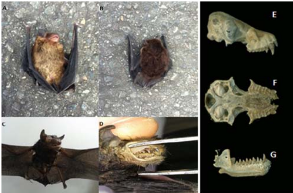
Figura 2. A y B. Vista ventral y dorsal del espécimen; C. Vista frontal en la que se observa la apariencia inflamada del hocico, característica típica del género Eptesicus ; D. Vista lateral de la fila superior de dientes, mostrando un único premolar grande que no deja un espacio libre detrás del canino; E. Vista lateral del cráneo; F. Vista ventral del cráneo; G. Vista lateral de la mandíbula.

presencia de una cresta sagital y cresta lambdaidea bien desarrolladas (Figura 2E). En vista lateral de la fila superior de dientes muestra un único premolar grande que no deja un espacio libre detrás del canino (Figura 2D). En la Tabla 1 se muestran las medidas del espécimen recuperado y se comparan con las realizadas por Ramírez-Chávez (2008) en su revisión de representantes de E. chiriquinus y E. brasiliensis para Colombia.