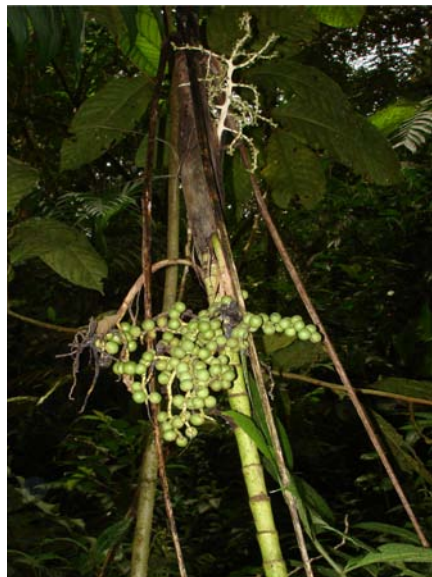
Figura 3. Frutos de Chamaedorea linearis (Ruiz & Pav.) Mart.

Ejemplares: ZULIA. Mpio. Rosario de Perijá, Cerro Las Antenas, 1450 msnm, 25/06/2009, Arias, J. C. 390, 398 (HMBLUZ); 27/06/2009, 395 (HMBLUZ). Hábitat local: Bosques húmedos montanos, altos, densos a medio-densos, naturales o semi-intervenidos (con poca perturbación, como algunas extracciones de árbo-