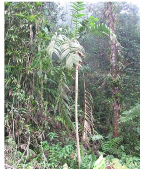
Figura 6. Individuo de Geonoma undata Klotzsch