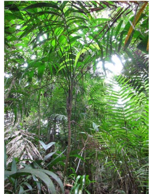
Figura 5. Ejemplar de Geonoma interrupta (Ruiz & Pav.) Mart.

Ejemplares: ZULIA. Serranía de Perijá, Cerro Las Antenas, 1500 msnm, 25-VI-2009; J.C. Arias 389 (HMBLUZ). Hábitat local: Bosques húmedos montanos, altos, densos a medio-densos, naturales o semi-intervenidos (con poca perturbación, como algunas extracciones de árboles maderables). Distribución en Venezuela: Aragua, Barinas, Carabobo, Distrito Federal, Falcón, Mérida, Miranda, Portuguesa, Táchira, Trujillo y Zulia, creciendo en el bosque nublado entre 1300 y 2895 msnm (Llamozas et al. 2003). Observaciones: Nuevo registro para el estado Zulia. Solo 10 individuos fueron hallados a 1540 msnm, expuesto a orillas de intersección entre carretera que comunica al sector Lajas con Cerro Las Antenas.