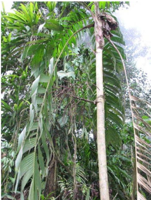
Figura 7. Inflorescencia de Geonoma undata Klotzsch