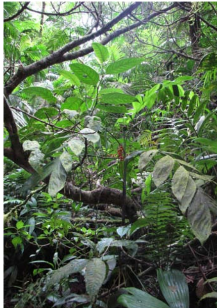
Figura 4. Individuo femenino de Chamaedorea pinnatifrons (Jacq.) Oerst.

Ejemplares: ZULIA. Mpio. Rosario de Perijá, Cerro Las Antenas, 1450 msnm, 25/06/2009, Arias, J. C. 390, 398 (HMBLUZ); 27/06/2009, 395 (HMBLUZ). Hábitat local: Bosques húmedos montanos, altos, densos a medio-densos, naturales o semi-intervenidos (con poca perturbación, como algunas extracciones de árbo-