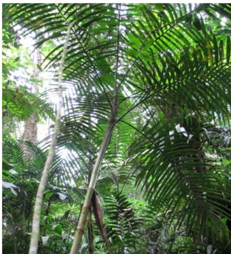
Figura 9. Individuo vegetativo de Prestoea acuminata (Willd.) H.E. Moore

pinnas a cada lado, regularmente dispuestas, pátulas. Inflorescencias que nacen por debajo de la vaina foliar, flores en tríadas irregulares, alzadas, sésiles o ligeramente pedunculadas; estaminadas con seis estambres fértiles dispuestos en dos verticilos: tres estambres cortos antisépalos insertos en la base de un pistilodio y tres estambres más alargados antipétalos insertos cerca del vértice del pistilodio. Infrutescencia infrafoliar rojiza. Frutos verdes cuando inmaduros, negros cuando maduros (Figura 8).