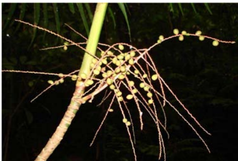
Figura 8. Frutos de Hyospathe pittieri Burret