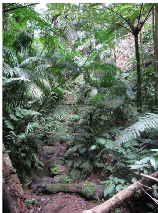
Figura 11. Bosque ribereño de H. pittieri y C. linearis .

montanos de la serranía de Perijá está causando severos impactos sobre la cobertura vegetal, generando extensos procesos erosivos y de sedimentación de las cuencas hidrográficas, como producto de la fuerte presión de uso de las tierras para el desarrollo agrícola incontrolado de la cuenca del río Lajas y otras áreas de la vertiente noreste de esta cordillera.