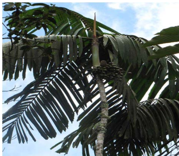
Figura 10. Individuo con frutos de Wettinia praemorsa (Willd.) Wess. Boer

Actualmente la tala y quema de los bosques