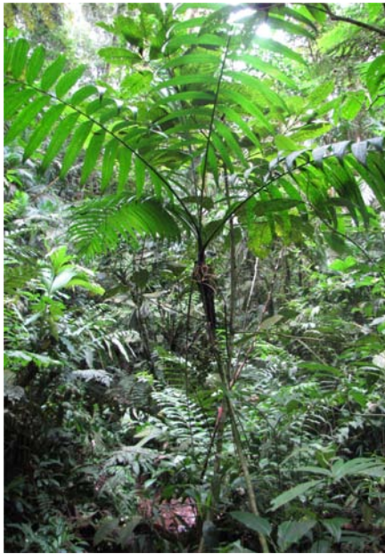
Figura 2. Individuo femenino de Chamaedorea linearis (Ruiz & Pav.) Mart.