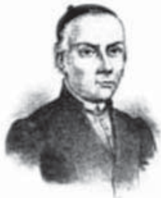
Figura 1. José Antonio Alzate, precursor de la divulgación científica en México.

nismo que poseía como profesores a los más destacados científicos del país, y poco a poco llegó a ser el semillero de los futuros científicos mexicanos. Muchos de sus egresados buscaron, de diversas maneras, impulsar el desarrollo de los diversos campos del conocimiento científico. Algunos de ellos se agruparon para fundar instituciones, sociedades y publicaciones científicas, como fue el caso de la Sociedad Científica Antonio Alzate y de sus Memorias , como se verá más adelante.