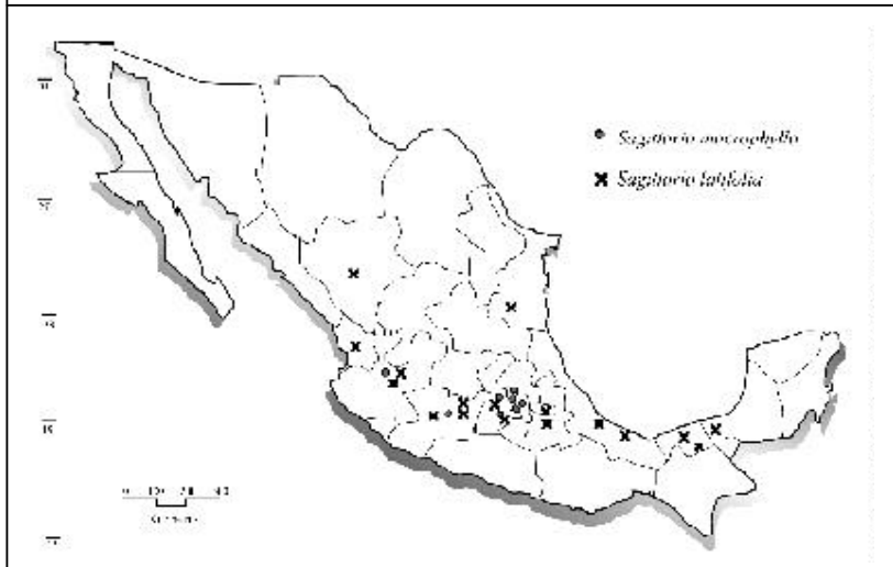
Figura 1. Mapa de distribución de Sagittaria macrophylla y Sagittaria latifolia en México (modificado de Lot et al., 1999).

Los fenómenos básicos de la biología y aprovechamiento de S. macrophylla y S. latifolia en México son desconocidos; lamentablemente los hábitats en los que se desarrollan se están alterando por las actividades humanas, tan intensamente que tienden a desaparecer. Por eso la finalidad de esta investigación fue delimitar la distribución actual de S. macrophylla y S. latifolia en el Estado de México y determinar el uso y aprovechamiento de ambas especies.