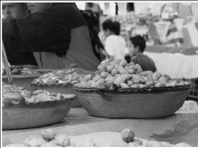
Figura 4. Venta de tubérculos de Sagittaria latifolia en el mercado artesanal de Almoloya de Juárez, Estado de México.