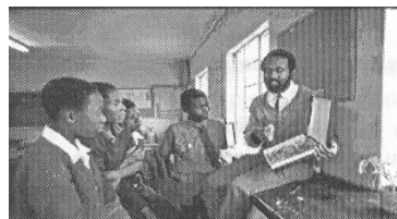
Fig.2- Um professor e seus alunos (classe de Biologia perto de Harare, Zimbabwe).