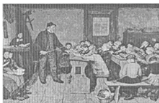
Fig.1- "The Village School" do pintor Albert Anker