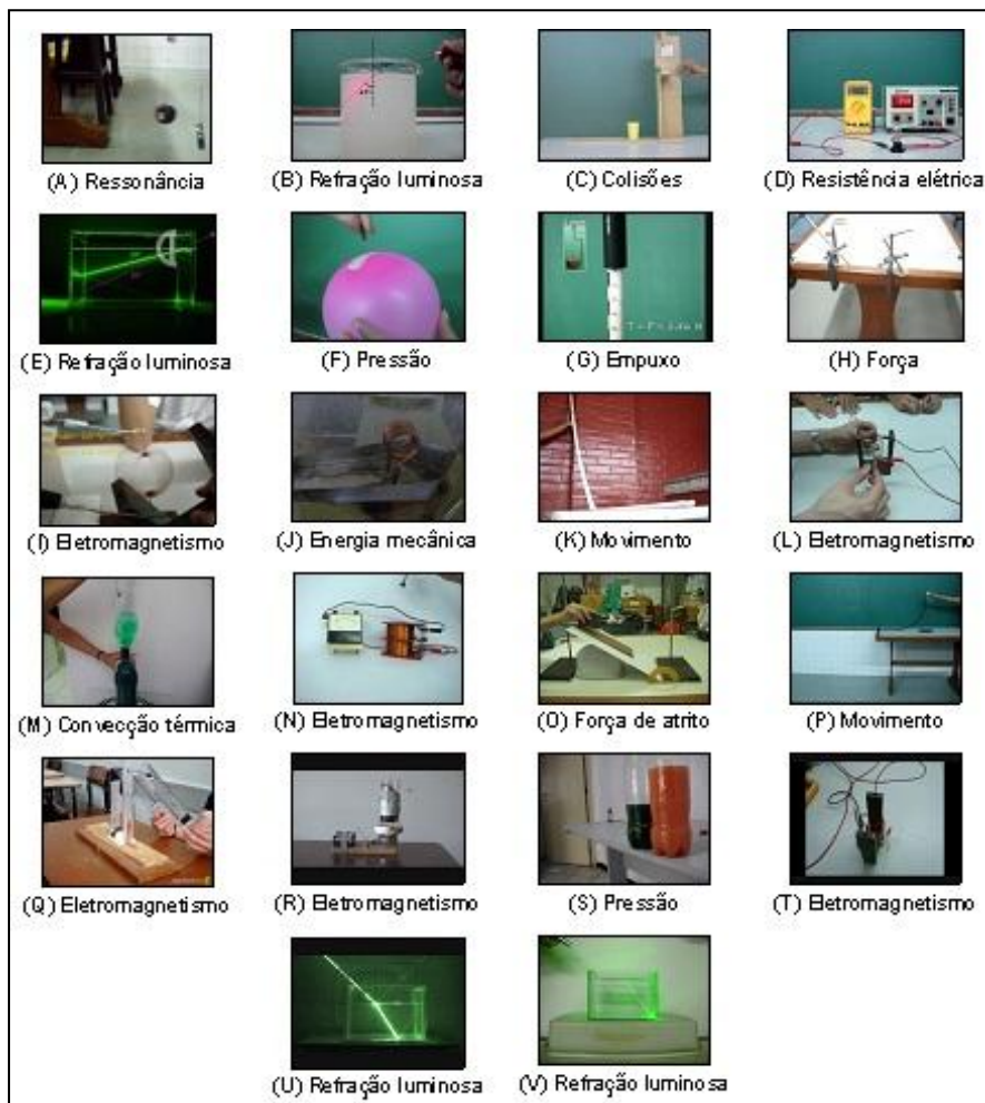
Fig. 2 – Imagens representativas dos vídeos produzidos.

A Fig. 2 mostra uma imagem representativa e o tema tratado em cada um dos vídeos, que, doravante, serão identificados pelas letras maiúsculas.