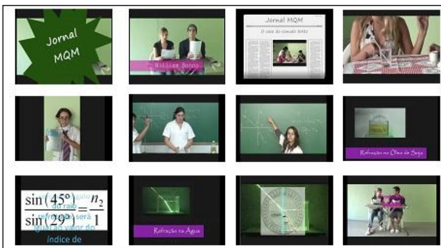
Fig. 4 – Imagens do vídeo U.