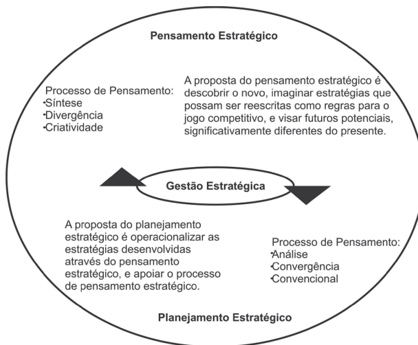
Figura 1: Pensamento Estratégico e Planejamento Estratégico

O planejamento estratégico não pode produzir as estratégias porque ele é pragmático e formalizado, se caracteriza como um processo analítico, e por isso deve acontecer após as estratégias terem sido decididas, descobertas ou simplesmente emergidas (HERACLEOUS, 1998). A Figura 1 demonstra a visão de Heracleous (1998) no que tange as relações entre o planejamento e o pensamento estratégico: