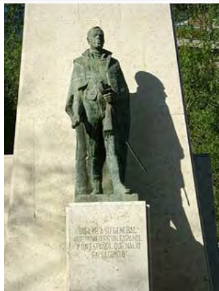
Imagen 1. José Romeu i Parras (retrato y escultura en su ciudad natal)