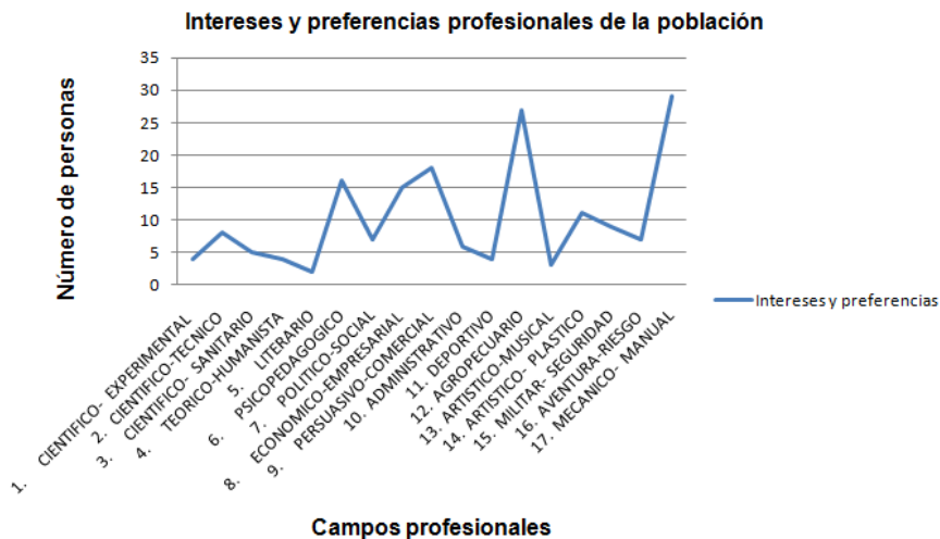
Figura 1 . Campos

siguientes agremiaciones; Asociación de Sordos de Barrancabermeja y el Magdalena Medio (ASOBAM) e Institución Educativa José Prudencio Padilla (CASD). En cuanto al nivel de escolaridad, es posible inferir que existe una alta tasa de deserción escolar en los niveles de educación primaria y bachillerato. De igual manera la tasa de ingreso a la educación superior es mínima. Por otro lado, es importante mencionar que gran parte de la población ha iniciado el ciclo de la secundaria y tan sólo un número levemente mayor ha culminado dicho ciclo. Así mismo el grado escolar con mayor participación de la población es el sexto. profesionales de interés y preferencia de la población.