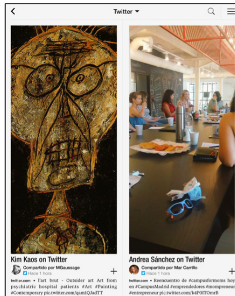
Figura 1: Captura de pantalla desde una tableta electrónica que muestra cómo la aplicación Flipboard dispone los tuits bajo un estilo de maquetación muy similar al del medio revista.

trasladado esta forma de relación con los medios de comunicación de masas a los medios sociales. Así, las actualizaciones de estado, los álbumes de fotografías publicados, los vídeos comentados por los miembros de sus SNS, etc., tienden a ser incorporados como materiales mediáticos que acompañan a las actividades cotidianas de los contactos. En este sentido, y de acuerdo con el V Observatorio de redes sociales desarrollado por The Cocktail Analysis en España (VVAA, 2013), el uso principal que los encuestados afirmaron hacer de Facebook, Twitter y Tuenti fue «ver actualizaciones de mis contactos» (73, 62 y 55 %, respectivamente). No comentar, escribir, ni hacer un like . La principal actividad que indicaron era observar las actualizaciones de sus contactos como si leyesen una revista o mirasen un escaparate. Las narraciones que construyen los sujetos pasan a integrarse así en la experiencia de consumo que plantea cada plataforma. Algunas aplicaciones como Flipboard, por ejemplo, llevan un paso más allá esta remediación de los contenidos personales en mediáticos, ofreciendo al usuario la posibilidad de leer las actualizaciones de sus contactos en Twitter como si se tratase de una revista de tendencias, como puede verse en la figura 1.