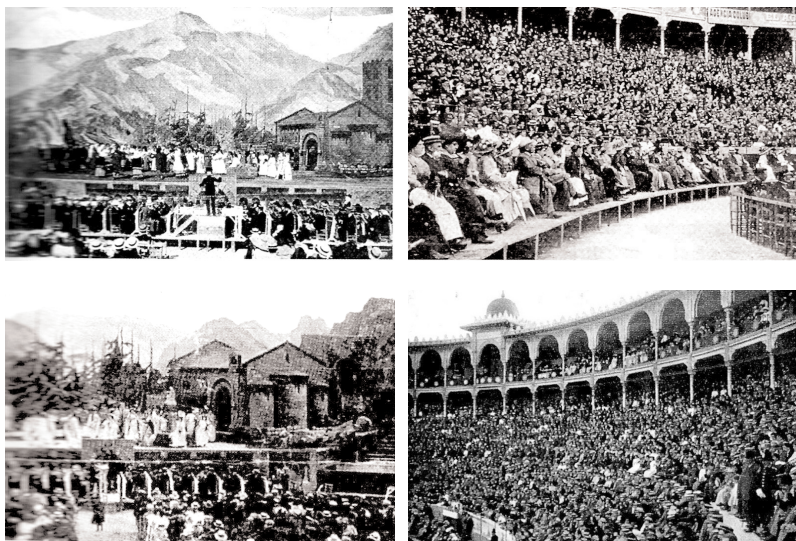
Fig. n.º 17.- Diversas imágenes de las representaciones de Canigó en junio de 1910 en la plaza de Las Arenas.

Por tanto, la adaptación escénica al aire libre del poema épico fue un ejemplo de wagnerismo, un ejemplo de la voluntad