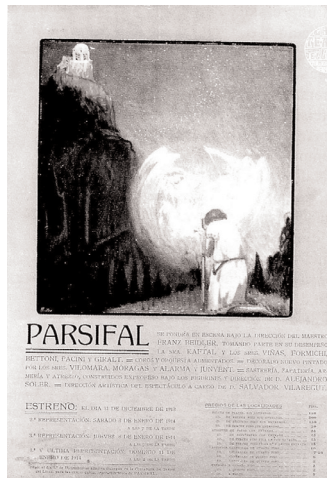
Fig. n.º 16.- Cartel del estreno de Parsifal en el Gran Teatro del Liceo, 1913.