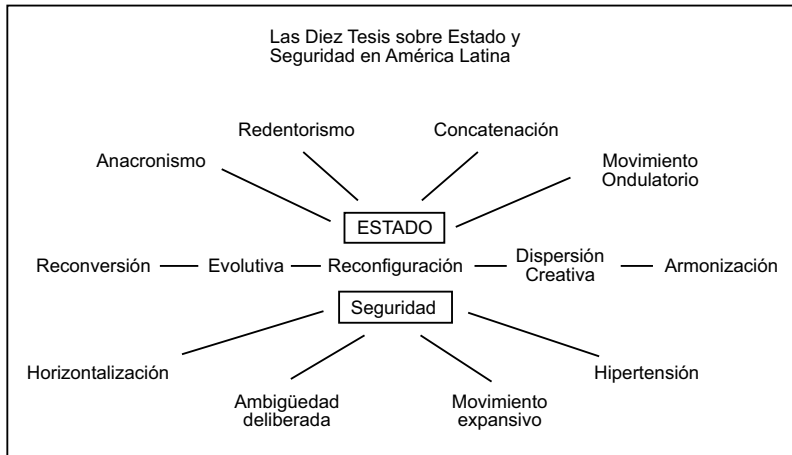
Figura 3. Las diez tesis sobre Estado y seguridad en América Latina

por medio de la sobrevaloración de su potencial represor (asociado a las dictaduras de corte militar).