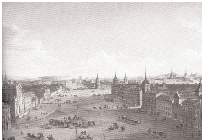
Fig. n.º 8.- Calle de Alcalá, al fondo Plaza de Toros Apud Reparaz, C. (2000): Tauromaquia Romántica , Consejería de Educación de la Comunidad de Madrid, pág. 17.

escasas excepciones: «Así, en 1840 toreará en cuatro festejos después de la canícula, antes de trasladarse a Andalucía; en 1841, vuelve a torear la temporada completa, aunque no lo hace entre junio y fines de septiembre por estar por provincias; en 1842 tan sólo actúa en cinco corridas madrileñas tras el verano; en 1845 lidia una corrida extraordinaria al estar de paso por la Corte, a la vuelta de Pamplona; y de ahí desaparece su nombre