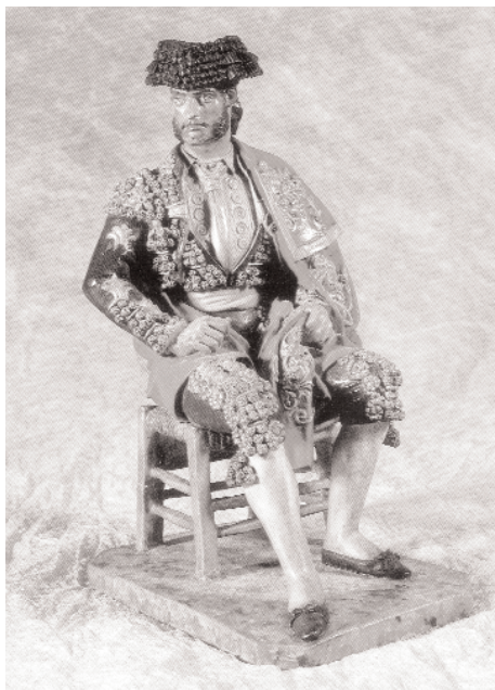
Fig. n.º 5.- Francisco Montes , barro policromado, escuela de imagineros malagueños. Museo Paquiro de Chiclana.