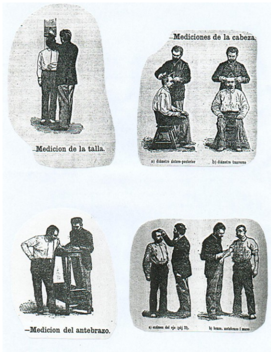
Figura 1. Mediciones de determinados rasgos físicos a los delincuentes, según la recomendación de Pedro N. Barros Ovalle. Manual de antropometría criminal i jeneral , Imprenta de Enrique Blanchard-Chessi, Santiago, 1900.