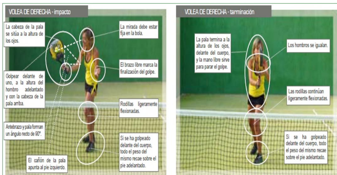
Figura 2. Fase de impacto y de terminación de la volea de derecha 3 .