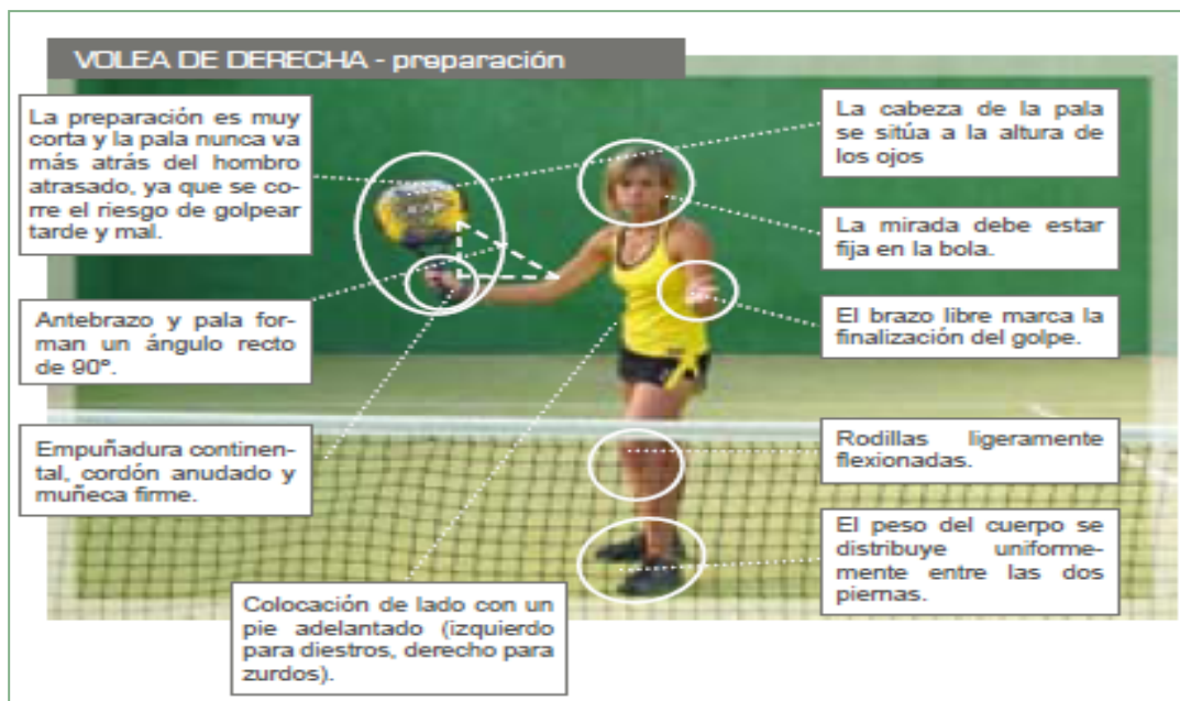
Figura 1. Fase de preparación de la volea de derecha 3 .

delante del cuerpo, señalando la pared de fondo. La pala se prepara abriéndose hasta la línea del hombro, ajustamos los pasos para la ejecución del golpeo (figura 2) e impactamos la bola justo delante de la cabeza. Tras el impacto la pala continúa el movimiento hasta encontrarse con la mano izquierda.