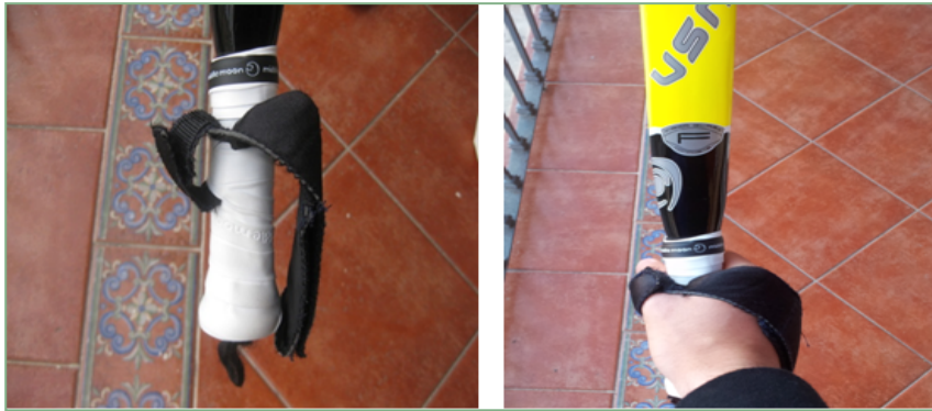
Figura 3. Grip con fijaciones en la mano

Hay un componente relevante para medir la efectividad, y es la demostración científica de que ésta se ha identificado como un parámetro pronosticador del rendimiento 10, 11, 12, 13, 14 . Además, debemos de tener en cuenta que la eficiencia es un factor delimitante en el éxito deportivo, como se ha demostrado en jugadores de pádel de alto nivel 15 .