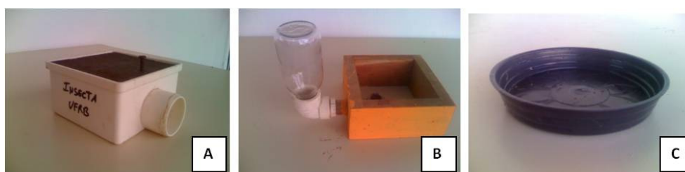
Figura 1. Alimentadores avaliados: Eiratama (A), Pernambucano (B) e Prato (C). (Devices evaluated: Eiratama (A), Pernambucano (B) and Prato (C)).