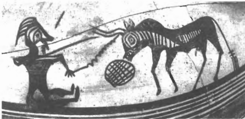
Fig. n.º 7.- Jarro chipriota con escena de tauromaquia (Karageorghis, 1965, figs. 14-15).