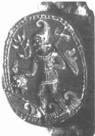
Fig. n.º 4.- Melkart con gorro frigio avanzando sobre las ondas del mar con la cabeza de un enemigo en la mano, según un escarabeo de Ibiza (Boardmann, 1984, n.º 61).

escudo con cabeza de león, en la mano derecha una cabeza cortada y en la izquierda una bipennis o hacha doble y una rama de árbol 34 (Fig. n.º 4). Esta enigmática escena representa probablemente a Melkart , a juzgar por su escudo leonino, que atraviesa el mar tras decapitar a un enemigo. En otro escarabeo, este personaje con gorro frigio , lanza, bipennis y escudo con umbo leoni-