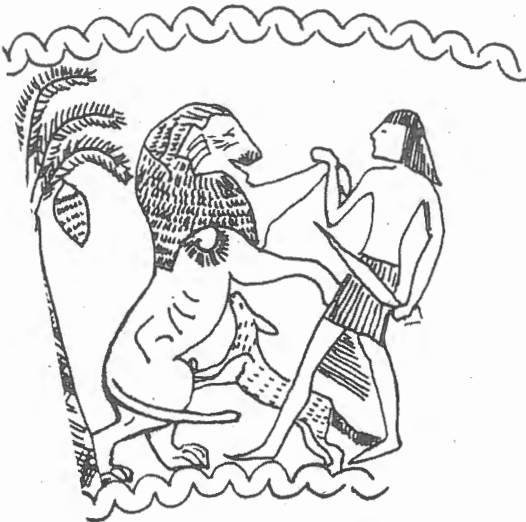
Fig. n.º 3.- Melqart cazando un león en un cuenco chipro-fenicio. Obsérvese la distinta forma de empuñar la espada (Neri, 2000, fig. 11).