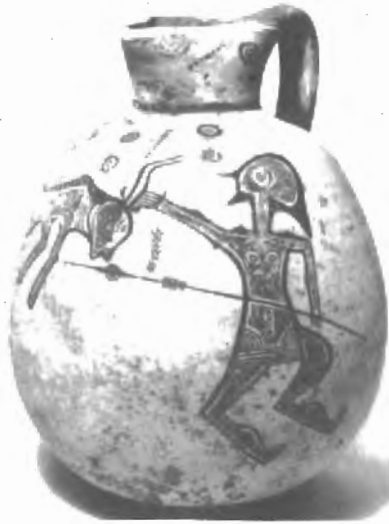
Fig. n.º 6.- Vaso chipriota con escena de tauromaquia (Karageorghis, 1965, fig. 13).