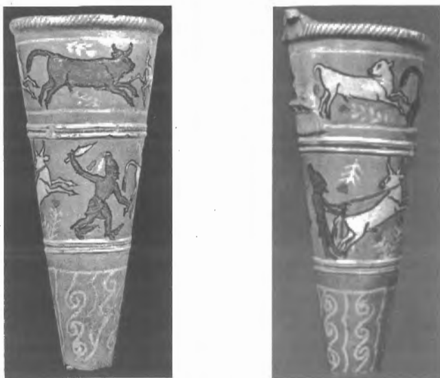
Fig. n.º 11.- Rhyton chipro-micénico de Enkomi con un héroe ( Melqart? ) que caza un toro (Karageorghis 1983, n.º 135).

Pero gracias a la iconografía, hoy podemos llegar a conocer la religión, la sociedad y la mentalidad del mundo fenicio y del tartésico, pues el significado de los mitos fenicios sería plenamente comprensible para los tartesios, como evidencian los relieves de Pozo Moro y los más modestos marfiles y bronceos hispano-fenicios 80 .