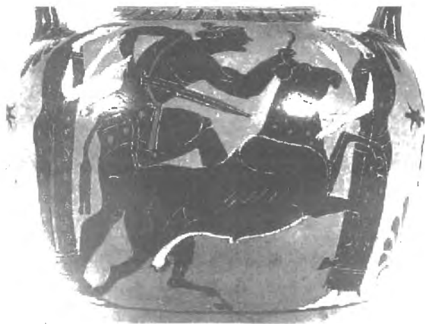
Fig. n.º 9.- Teseo y el Toro de Maratón , según un vaso ático de fines del siglo VI a.C. (LIMC VII,2).

libre 69 , siendo Teseo el que más tarde lo apresó definitivamente. Las primeras representaciones del Toro de Creta son de mediados del siglo VI a.C. y siguen el esquema de la lucha de Heracles con el Jabalí de Erimanto, con el León de Nemea o la de Teseo y el Toro de Maratón, mito paralelo al de Heracles y el Toro de Creta,