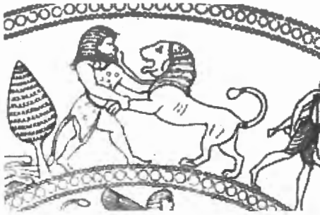
Fig. n.º 2.- Melqart con la piel del león en un cuenco chipro-fenicio (Markoe 1995, n.º Cy5).