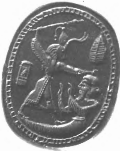
Fig. n.º 5.- Melqart-Nergal con cabeza de toro sacrificando con su maza a un monstruo marino (Culican, 1986).

do la cabeza (Fig. n.º 5). Este personaje con gorro frigio aparece con la bipennis en la mano derecha en un sello de Akko (Palestina) 37 , en dos escarabeos de Tharros (Cerdeña) y en una navaja de afeitar y en un anillo de oro de Cartago, en el que vence a un león sobre el que tiene su pierna izquierda. Culican consideró que este Héroe de la bipennis y el gorro frigio , cono-