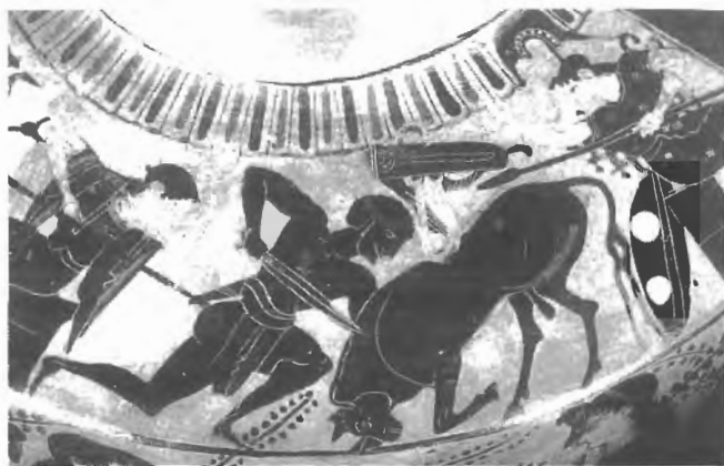
Fig. n.º 8.- Heracles y el Toro de Creta , según un vaso ático de fines del siglo VI a.C. (LIMC V).

mito está relacionado con Pasife 67 , una acepción de la Luna, hija de Apolo y mujer de Minos, quien engendró al Minotauro de su unión con un Toro salvaje enviado por Poseidón a Creta como castigo: el animal destruía con su fiereza las murallas de las ciudades, arrasaba los campos con fuego y mataba al que encontraba 68 , lo que evidencia su inspiración en el mito de Gilgamesh y el Toro Celeste mesopotámico. En la versión griega más difundida, Heracles captura al toro y lo lleva vivo a Euristeo, ofreciéndolo después en sacrificio a Hera o, según otras versiones, lo dejó