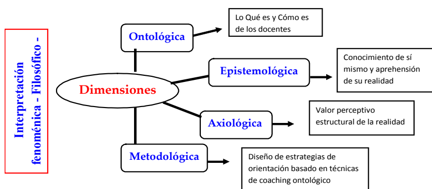
Gráfico 1. Síntesis - Interpretación Fenomenológica - Filosófica -Pragmática

En síntesis, de la interpretación fenomenológica de este estudio, emergieron cuatro dimensiones filosóficas pragmáticas que se ilustran a continuación: