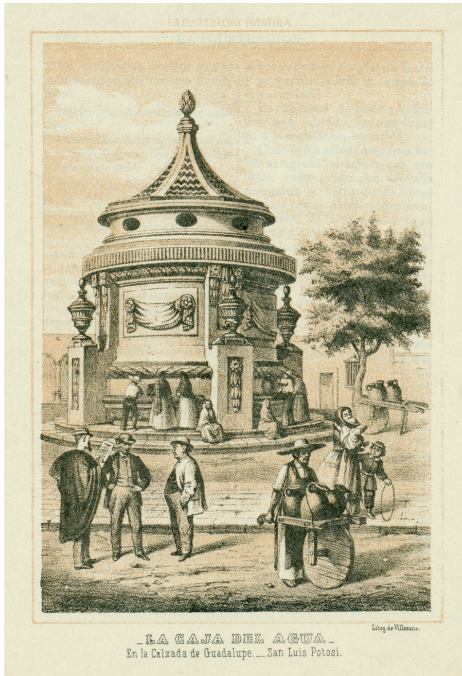
Figura 3. Litografía de José Ma. Villasana, 1869, Caja de Agua

Fuente: José María Villasana. 1869. "La caja del agua. En la Calzada de Guadalupe. _San Luis Potosí". En La Ilustración Potosina. Semanario de literatura, poesías, novelas, noticias, descubrimientos, variedades, modas y avisos , eds. José Tomás de Cuellar y José María Flores Verdad. San Luis Potosí: Tipografía de Silverio María Vélez, 172.