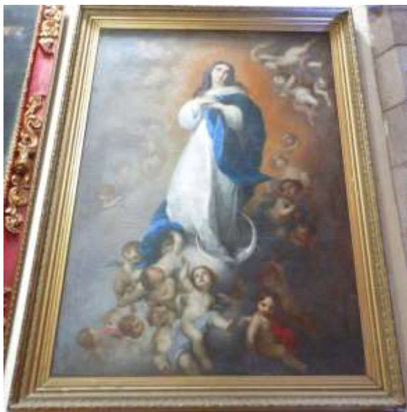
Fig. 3. Inmaculada , copia de Bartolomé Esteban Murillo. Catedral, Quito. Anónimo, S. XIX.

y también el Buen Pastor Niño de colección particular quiteña, de escaso mérito artístico aunque no tan desafortunado como el del Museo Alberto Mena Caamaño, que citamos más arriba.