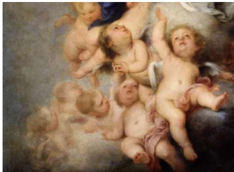
Fig. 7. Inmaculada de Sault . Museo del Prado, Madrid. Bartolomé Esteban Murillo, 1678.