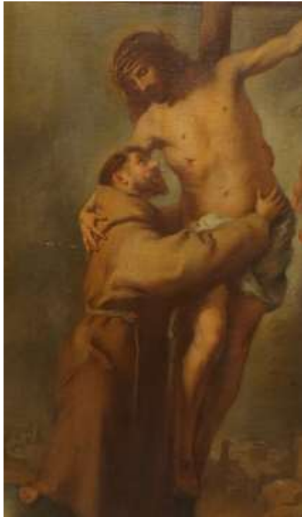
Fig. 2. Detalle de San Francisco abrazando al Crucificado , copia de Bartolomé Esteban Murillo. Museo Alberto Mena Caamaño, Centro Cultural Metropolitano, Quito. Anónimo, S. XIX.