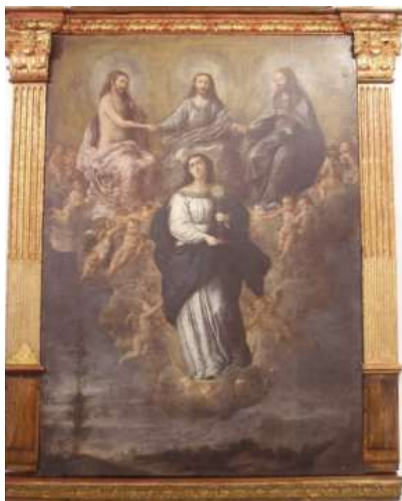
Fig. 4. Inmaculada Eucarística . Museo Fray Pedro Gocial, Convento de San Francisco, Quito. Miguel de Santiago, tercer tercio del s. XVII.

Aunque nadie discute la maestría del artista andaluz a la hora de tratar el tema, desde la historiografía ecuatoriana, incluso bien entrado el siglo XX, se incidía en la superioridad de Santiago en la representación de la Inmaculada. El padre Vargas defendía que mientras Rafael y Murillo repetían con ligeras variantes los modelos de sus Inmaculadas o Vírgenes, para Miguel de Santiago “la visión de la Inmaculada tuvo siempre matices de novedad” 70 . Así, la Inmaculada Eucarística del convento de San Francisco no sólo se equipararía técnicamente a las de Murillo, sino que las superaría en expresión teológica (Figuras 4 y 5) 71 . Veinte años más tarde seguía reafirmando esta idea, pues opinaba que una vez que el sevillano encontró una forma de representación satisfactoria, la repitió con insistencia, algo que no haría Miguel de Santiago 72 . Eso sí, también hubo autores americanos que entendían que la aproximación que intentaron los pintores quiteños –y no sólo Miguel de Santiago- a los maestros españoles no fue conseguida