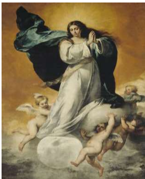
Fig. 5. Inmaculada “la Colosal” . Museo de Bellas Artes, Sevilla. Bartolomé Esteban Murillo, ca. 1650.

Incluso décadas después de González Suárez se cimentaba esta supuesta influencia en el hecho de que a Quito hubiesen llegado obras de la mano del propio Murillo.