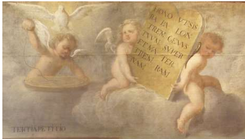
Fig. 6. Detalles de la Doctrina cristiana . Museo Fray Pedro Gocial, Convento de San Francisco. Miguel de Santiago, ca. 1670.