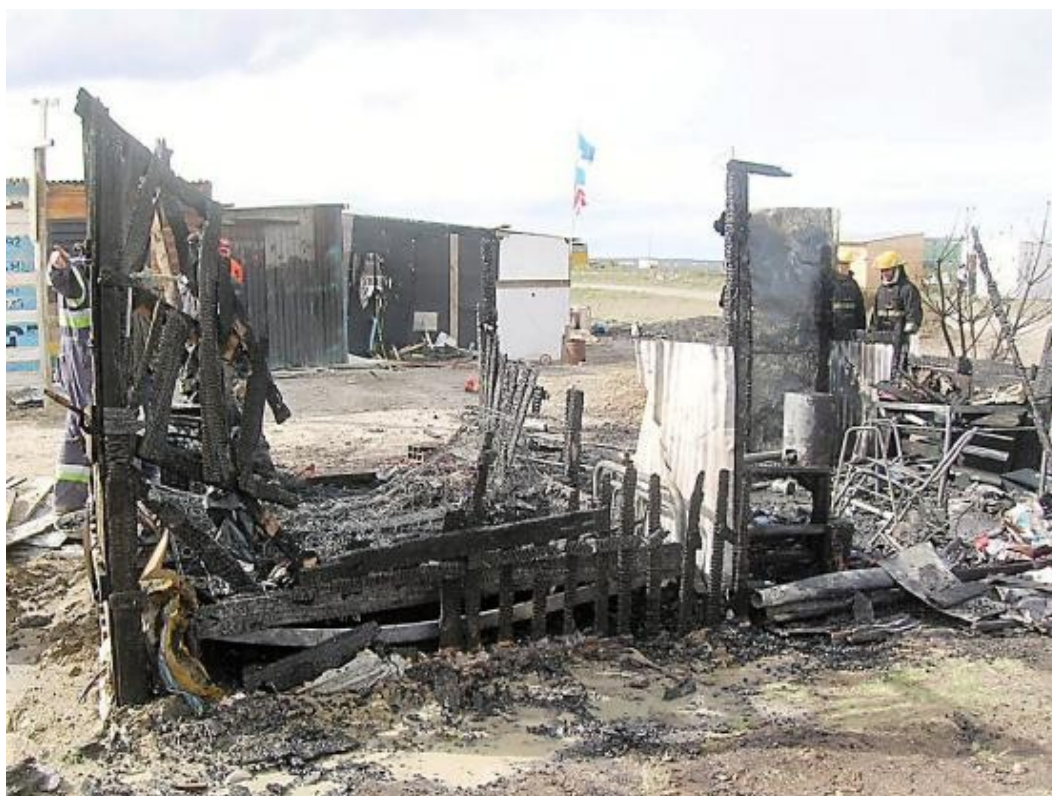
Foto 6: Restos de una vivienda consumida totalmente por las llamas.

eléctricos, que en algunos casos han derivado en incendio de la vivienda con la respectiva pérdida total de la misma (situación agravada por el tipo de material que reviste a las mismas y por el reducido tamaño). Si bien los casos de cortocircuitos por fallas en los aparatos (principalmente los de calefacción) son comunes, han sido menos frecuentes los incendios ocurridos, sin embargo, la pérdida en todos los casos ha sido total (Foto 6).