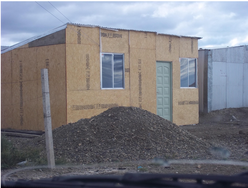
Foto 2: Modelo de vivienda construida con paneles de madera prensada.

En relación al interior de las casas y, teniendo en cuenta las entrevistas realizadas a profesionales del C.I.C. Jesús Misericordioso, se detectó que “algunas de las casas tienen piso de tierra, otras le han puesto los paneles de madera en que vienen los ladrillos (pales)”. Evidentemente ninguna posee base de concreto o platea, debido a que se ha usado solo material ligero en la construcción, sumado esto a que durante mucho tiempo les prohibieron el ingreso de material grueso (ladrillos, cemento, arena, etc.). Poseen un revestimiento interior poco adecuado para soportar las bajas temperaturas, por lo que es inevitable la presencia de calventores (en ocasiones 2 o más).