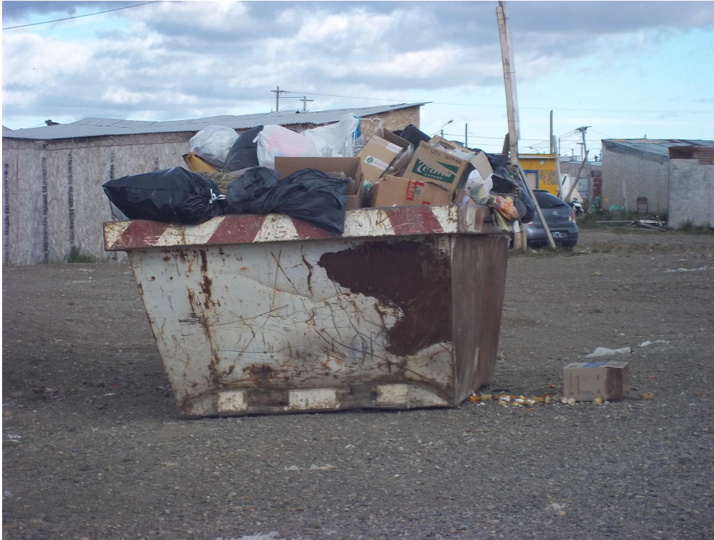
Foto 9: Los contenedores de basura desbordados por la cantidad de residuos.

deseadas en los alrededores del contenedor o que los vecinos decidan tirar su basura en otros lugares (por lo general es en espacios vacíos dentro del asentamiento).