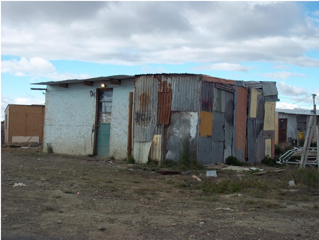
Foto 3: Modelo de vivienda construida en base de a chapas metálicas.