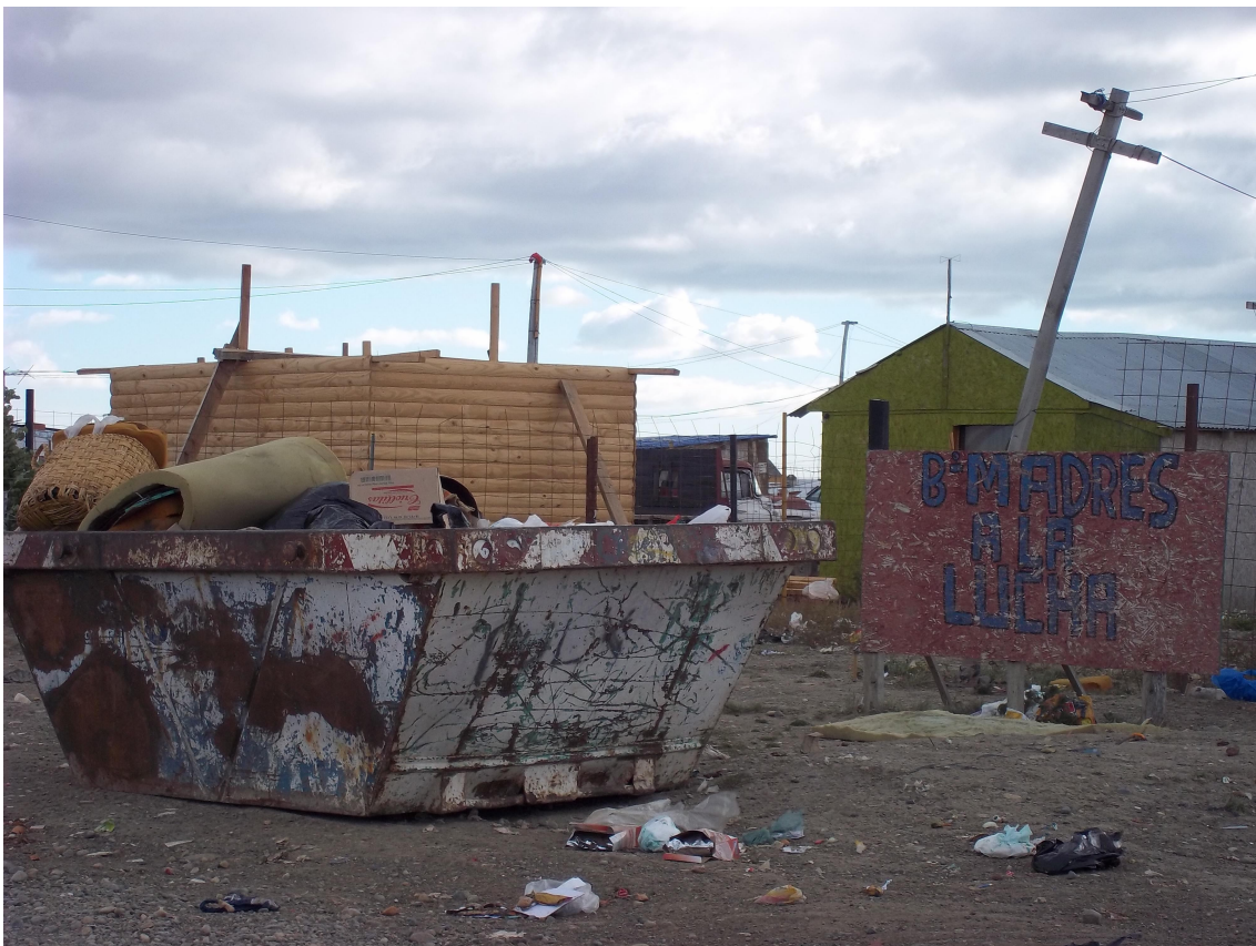
Río Gallegos, 13 de Diciembre de 2010.