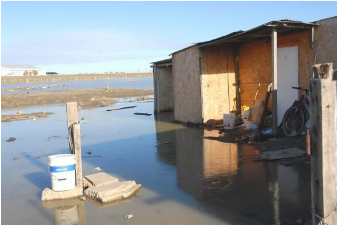
Foto 1: Daños en viviendas provocados por anegamiento luego de 3 días de intensa lluvia.

en el hecho de que muchos de los habitantes del asentamiento va a recolectar objetos del propio vaciadero, ya sea para utilizar en la construcción de las viviendas o, en algunos casos, ropa y juguetes. Esto implica el hecho de generar nuevos “mini basurales” en el exterior de las viviendas, lo que atrae a numerosos roedores e insectos y por ende, agudiza aún más la situación.