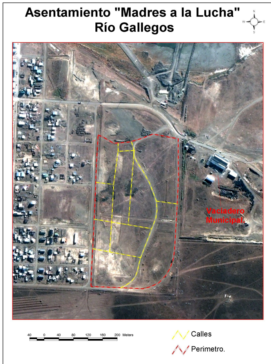
Figura 3: Ubicación del asentamiento "Madres a la Lucha" en cercanías del Vaciadero Municipal de la ciudad de Río Gallegos. Compuesto por Cristian Ampuero.