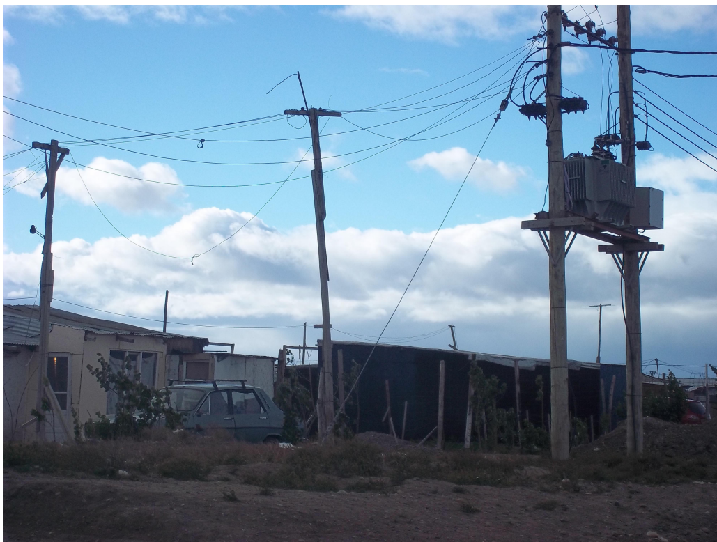
Foto 5: Postes de luz precarios conectados al transformador de Servicios Públicos.

debido a la configuración de la mayoría de las casas (con poca cantidad de ventanas y de pequeño tamaño), se requiere la generación de luz artificial para poder mantener la visibilidad interna de las mismas durante la mayor parte del día (situación que se agudiza aún más en la época invernal cuando las noches son más largas y los días más cortos).