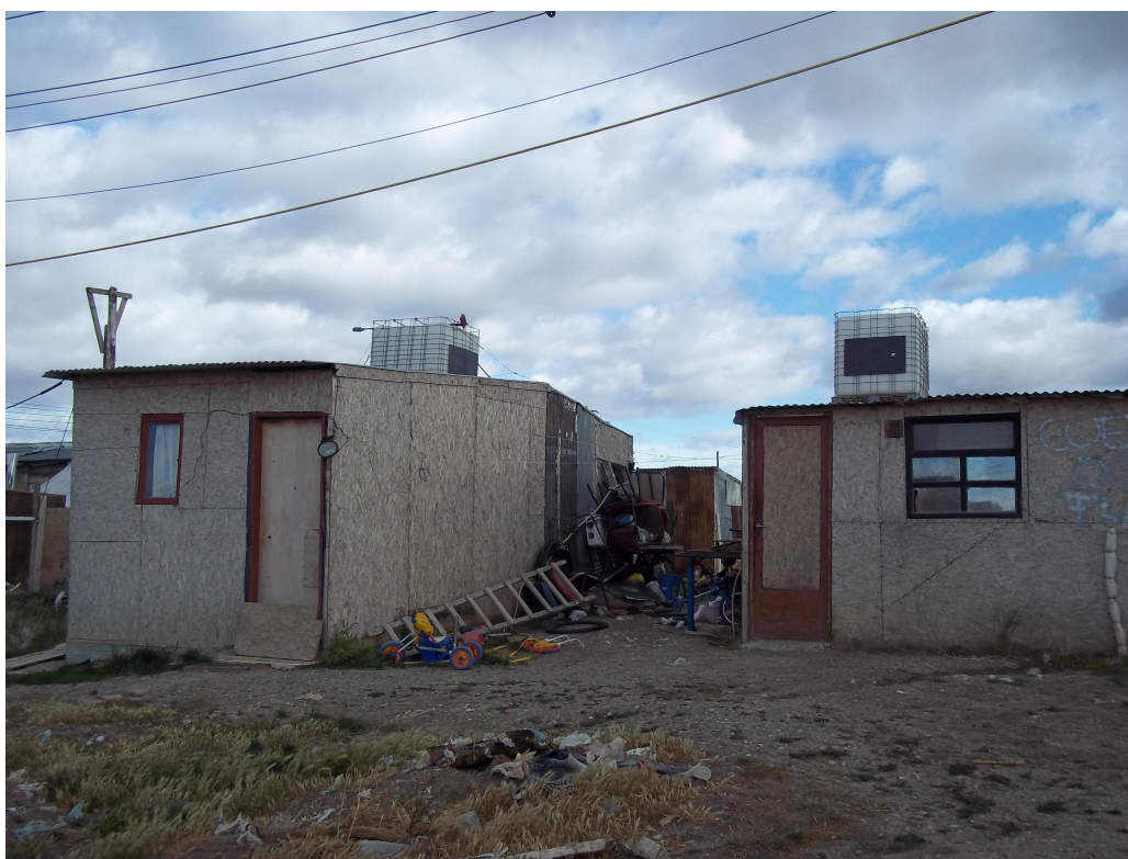
Foto 7: Viviendas en las que se observa la presencia de tanques de agua en los techos.

El uso que hacen del servicio no difiere al de cualquier vivienda de la ciudad (cocina, higiene, limpieza, etc) sin embargo la precariedad del mismo hace que tengan ciertas limitaciones en el uso. Por ejemplo, la mayor parte de las viviendas sólo posee agua fría (una pequeña cantidad posee pequeños termotanques eléctricos que calientan el agua a medida que sale), a su vez, la presión de agua varía constantemente y es muy común que tengan poca presión en horarios donde se utiliza en forma simultánea en todo el asentamiento; frente a esta situación algunos vecinos con mejor situación económica han optado por colocar tanques de agua en el techo de las viviendas (Foto 7).