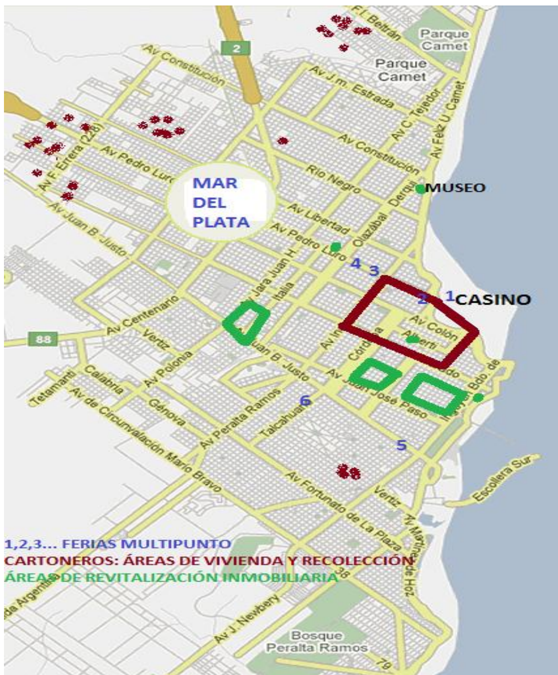
Elaboración propia sobre la base cartográfica de Municipalidad de General Pueyrredón.