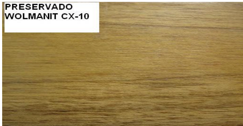
Figura 5. Fotografía de madera de Tectona grandis preservada con Wolmanit CX-10®.

La madera tratada con los preservantes anteriormente descritos, tiene la ventaja de poder usarse en exteriores, inclusive en ambientes extremos como el trópico y en contacto con el suelo, además se vuelven resistentes al ataque de hongos e insectos. Sin embargo su principal desventaja es que una vez tratada la madera, esta se torna de un color verdoso por efecto del cobre, lo cual se convierte en un problema máxime en una especie como la teca, que es tan apreciada por su color natural (Figura 5).