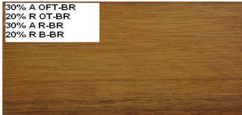
Figura 6. Fotografía de madera de Tectona grandis preservada con Wolmanit CX-10® y entintada con cuatro tipos de tinte.

En el segundo se emplearon solo dos tintes (uno amarillo y uno rojo), ambos se aplicaron en proporciones similares (50% cada uno) y también se obtuvo un resultado considerado como satisfactorio.