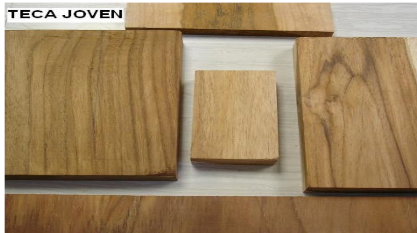
Figura 3. Fotografía diferentes muestras de duramen de Tectona grandis , proveniente de plantaciones de Costa Rica.