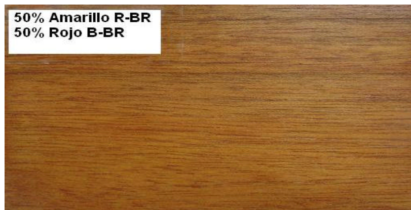
Figura 7. Fotografía de madera de Tectona grandis preservada con Wolmanit CX-10® y entintada con dos tipos de tinte.

En el segundo se emplearon solo dos tintes (uno amarillo y uno rojo), ambos se aplicaron en proporciones similares (50% cada uno) y también se obtuvo un resultado considerado como satisfactorio.