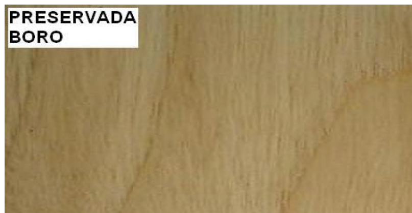
Figura 4. Fotografía de madera de Tectona grandis preservada con boro.

Este método se usa mayormente con preservantes hidrosolubles a base de sales de boro (ácido bórico y borato de sodio), el cual se difunde muy bien en la madera, es un excelente insecticida, presenta baja toxicidad para humanos y mamíferos y no cambia el color de la madera (Figura 4). Sin embargo, presenta la desventaja de no poder usar la madera tratada con este método en exteriores, debido a que el boro se lixivia por acción de la lluvia.