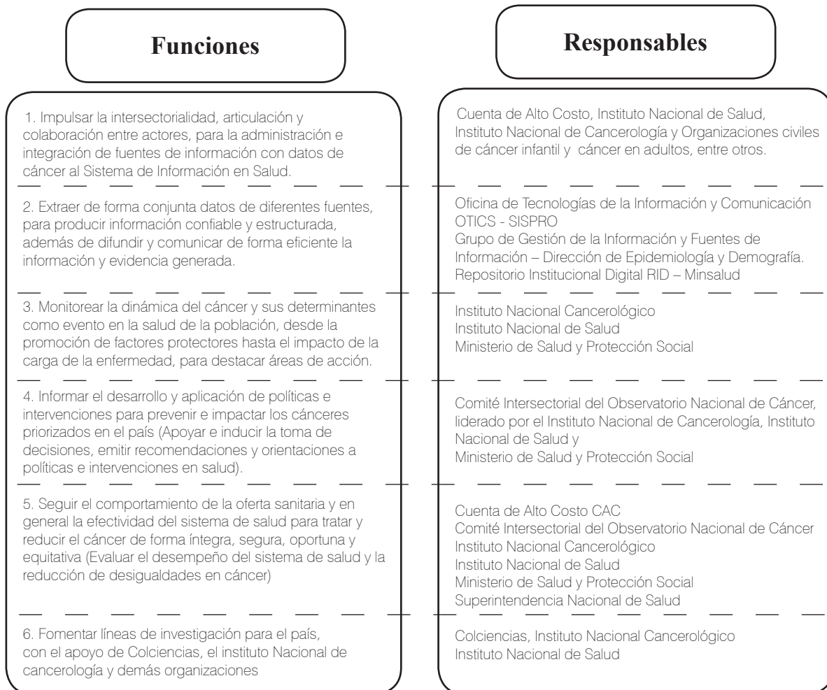
Figura 2. Funciones del Observatorio Nacional de Cáncer de Colombia

En consecuencia, el rol del observatorio es gestionar el conocimiento a partir de las fuentes conjuntas de información para abordar el cáncer como un problema de salud pública, y contribuir con la orientación de estrategias para reducir la carga de enfermedad y desigualdades sociales por esta causa en Colombia. La figura 2 ilustra las funciones del ONC Colombia con sus responsables.