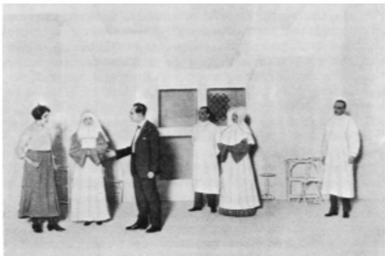
Fig. n.º 13.– Escenario de la representación de Sinrazón , estrenada en el Teatro Calderón de Madrid, el 8 de abril de 1928 (García-Ramos y Narbona, 1988: 157).

Que tal es el precio de la concesión a la sinrazón, es decir, la entrega a la esperanza aun a costa del juicio, lo sabe perfectamente el doctor Ballina como lo sabe su creador Ignacio Sánchez Mejías, hombre cuya profesión tiene como condición de posibilidad el no estimar, bajo ningún concepto, que el límite entre la verdad y la mentira es una mera cuestión de voluntad.