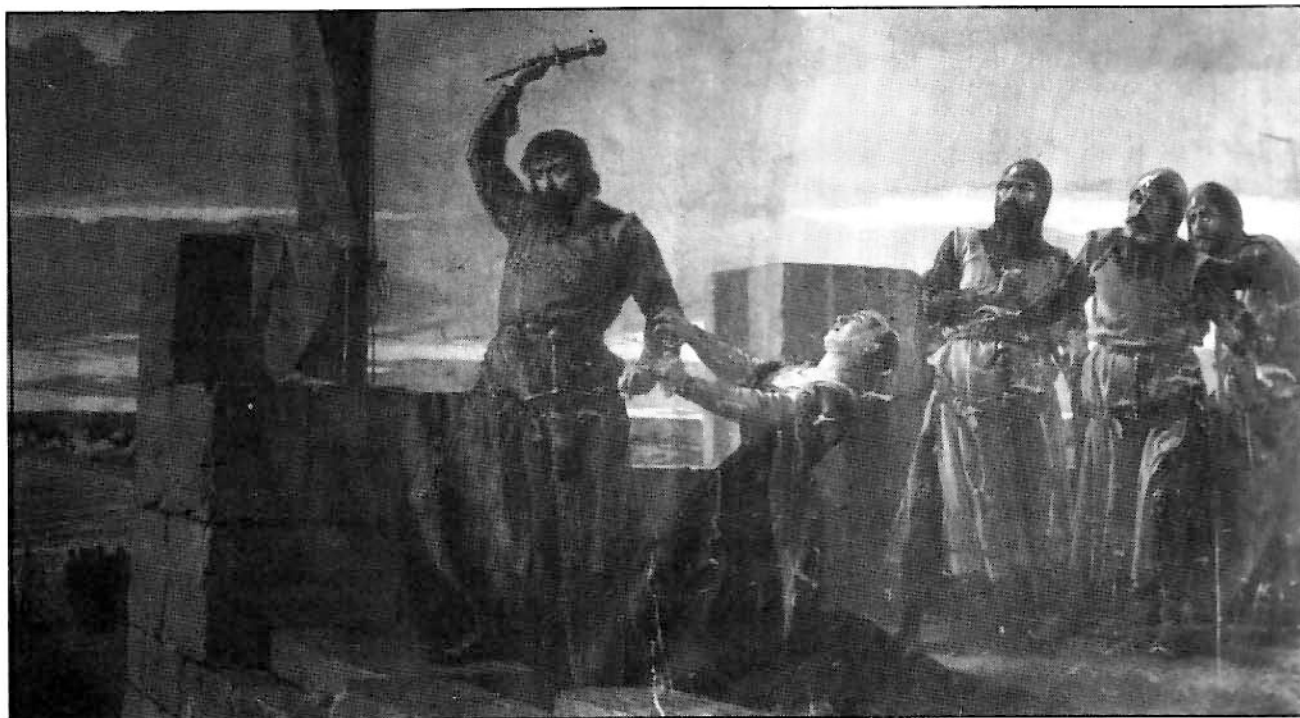
Guzmán el Bueno , cuadro de Salvador Martín Cubells.