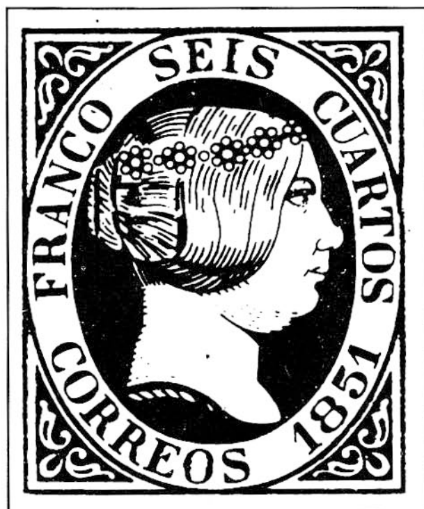
El primer sello español

Finalmente, el período tercero, que paulati-