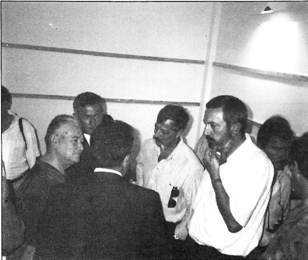
Momento de la clausura de la Exposición Filatélica.