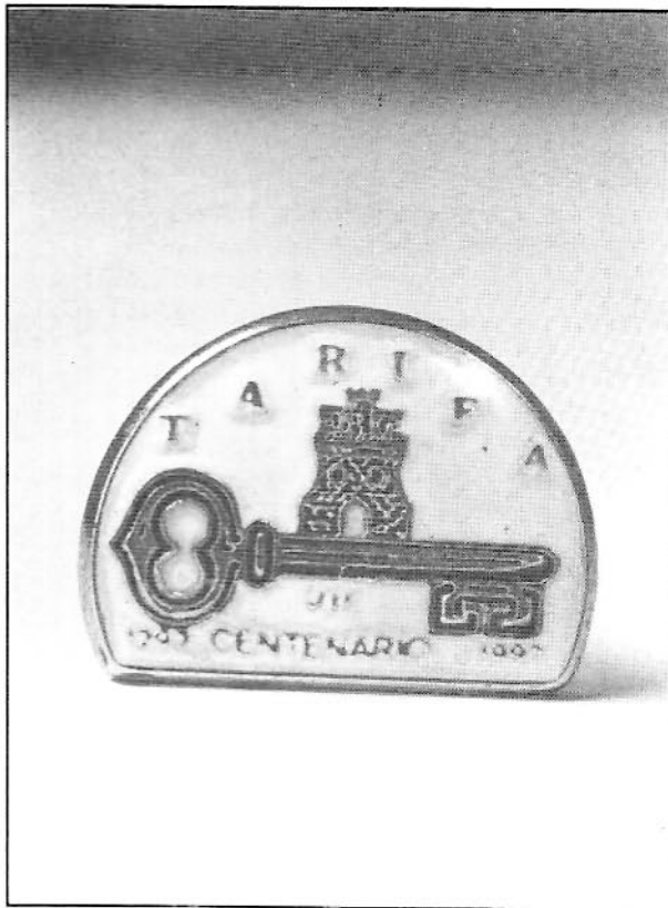
Insignias puestas a la venta, con el logotipo del VII Centenario..

Quizás ustedes se pregunten ¿qué pasará después del 21 de septiembre?. En cuanto respecta a la revista, ésta seguirá editándose (y