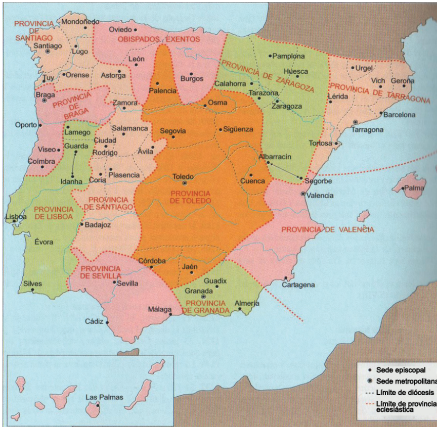
Mapa 3. Diócesis peninsulares en la Baja Edad Media.

da, que, convertido al Islam, había entregado la villa al enemigo). A ello hay que unirle la propia inestabilidad política en la que se sumió el Reino de Murcia con la guerra civil entre los Fajardo sobre todo a partir de 1445 y el proceso de “señorialización” de la zona en manos de los linajes Fajardo y Manrique, de un lado, y Pacheco de otro. En este sentido, hay que recordar aquí los intereses aludidos del marqués de Villena en Xiquena, de donde llegó a obtener el título de conde, embolsándose el dinero para la repoblación y consiguiendo de Enrique IV en 1470 un privilegio de homicianos de escasa efectividad 53 .