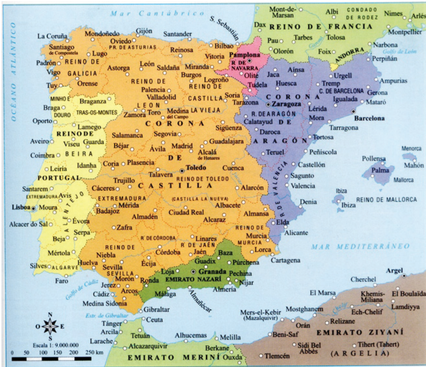
Mapa 1. La Península Ibérica a mediados del siglo XV.

ternamente, entre otros factores, hicieron que el emirato sobreviviera durante más de doscientos cincuenta años, protagonizando una tercera parte de la historia de al-Andalus y dando lugar al surgimiento de la frontera entre Islam y Cristiandad más duradera de Europa occidental 3 .