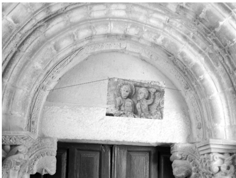
Fig. 8. Posible situación original del relieve de la Lapidación de San Esteban en el tímpano de la puerta de la iglesia.

No cabe duda de que esta obra pertenecía al templo, en el que ocuparía un lugar destacado, dada su temática. Allí la vio Quadrado, aunque entonces estaba ya apoyada en el suelo. Es posible que formara parte de la decoración de la puerta occidental (fig. 8). Hemos visto que el terremoto de Lisboa causó daños muy importantes en el edificio. Quizás uno de ellos fue el resquebrajamiento del tímpano, lo que obligaría a desmontarlo y sustituirlo. El tamaño de las figuras nos permite considerar esta posibilidad y, además, Gómez-Moreno aludió a la existencia de otro fragmento esculpido, en el que se representaba una especie de perro, que pudo formar parte de la escena 69 .