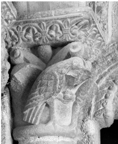
Fig. 5a. Capitel de la portada de San Esteban de Corullón.

En el capitel de las aves (fig. 5a), las plumas cortas cubren sólo una parte del cuerpo y de las alas, que se prolongan en plumas largas sobre la cola terminada abruptamente. Un modelo muy parecido se encuentra en varios capiteles de la girola de Santiago. Es característico de este grupo compostelano, que las aves picoteen algo y sus cabezas estén separadas por un elemento saliente, ya sea una concha o una penca. Además, en uno de ellos, la forma romboidal de las plumas cortas con los raquis bien marcados coincide con el ejemplar de Corullón 67 (fig. 5b).