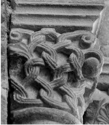
Fig. 6a. Capitel de la portada de San Esteban de Corullón.

Los capiteles con tallos entrelazados (fig. 6a) tienen una presencia notable en el templo de San Isidoro de León, en donde se advierte un trabajo de calado muy profundo que encuentra su referente de manera clara en Saint-Sernin de Toulouse 68 . Pero, la pieza más parecida a la de San Esteban, por su plasticidad, se encuentra en Compostela (fig. 6b), situada en el tramo de la girola que se abre al brazo sur del transepto y, por lo tanto, del periodo anterior al episcopado de Diego Gelmírez.