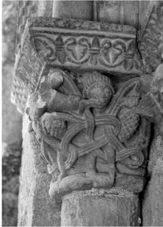
Fig. 4a. Capitel de la portada de San Esteban de Corullón.