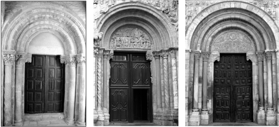
Fig. 3.- Puerta de San Esteban de Corullón, Puerta de Platerías en la catedral de Santiago de Compostela y Puerta del Cordero en San Isidoro de León.

En cuanto a los capiteles -analizados uno a uno desde el exterior izquierdo- encontramos, en primer lugar, una cestilla donde aparecen dos figuras desnudas, que hacen sonar sendas bocinas, aprisionadas por vástagos de vid entrelazados de los que cuelgan racimos.