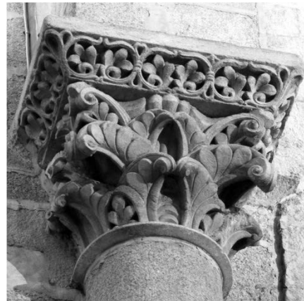
Fig. 7b. Capitel de la catedral de Santiago de Compostela.