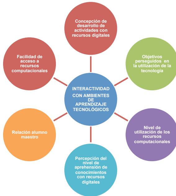
Figura 1. Constructos de las categorías de ambientes de aprendizaje e interactividad

Todo lo anterior implica una relación de los recursos digitales con los temas de los cursos, los objetivos que se persiguen con el uso de la tecnología, el nivel de utilización de los recursos digitales, el nivel de aprehensión en los alumnos del curso de BD, y la facilidad de acceso a los recursos digitales.