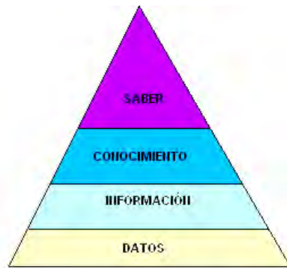
Figura 3. Nivel de las definiciones. Elaboración propia.

Se vislumbra, a partir de lo anterior, una pirámide muy sencilla, de acuerdo con lo que mencionan estos autores, tal como se observa en la figura 1, donde la base son los datos y el fin último puede llegar a ser el saber.