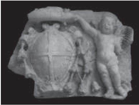
figura 5: Relliu heràldic del Museu de Tortosa amb l'escut del bisbe fra Sever Tomàs Auther.