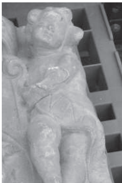
figura 14: Detall de l'escut amb un cap d'angelet.