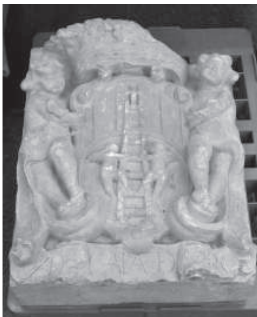
figura 13: Escut heràldic d'Escaladei, conservat al Museu de Lleida: Diocesà i Comarcal.