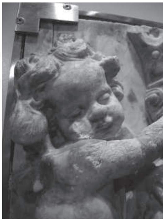
figura 18: Cap d'àngel, detall de l'escut d'Escaladei del Museu de Tortosa.