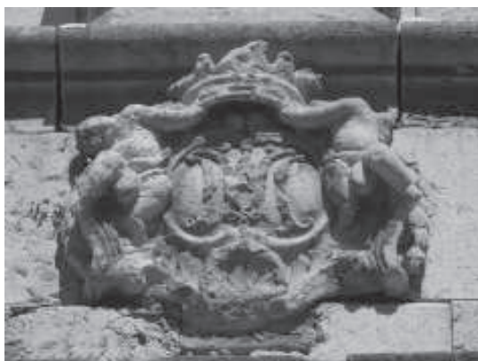
figura 15: Escut amb l'emblema de Maria, façana d'entrada a la cartoixa d'Escaladei.