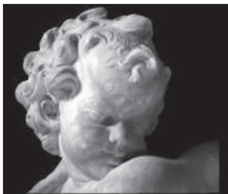
figura 3: Cap d'un angelet de la catedral de Tortosa, compareu-lo amb la fotografia anterior.