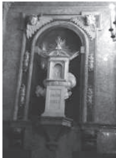
figura 8: Nínxol de la capella de la Cinta de la catedral de Tortosa amb la representació simbòlica de la Porta del Cel .