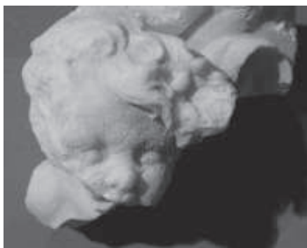
figura 17: Fragment de cap trobat a les excavacions d'Escaladei.