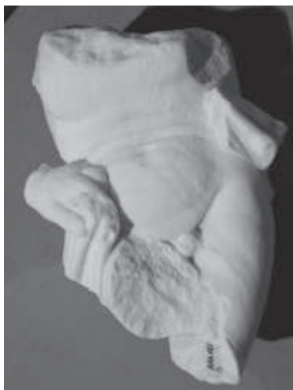
figura 16: Tors trobat a les excavacions d'Escaladei.