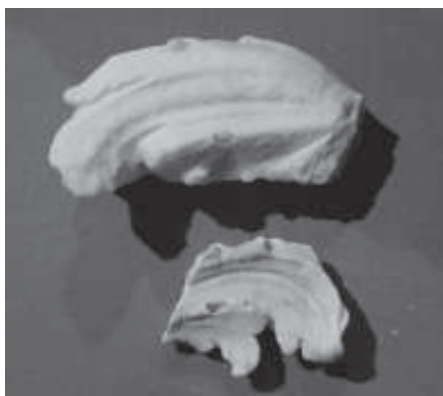
figura 19: Fragments de fulles d'acant trobat a les excavacions d'Escaladei.