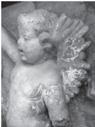
figura 7: Detall del relleu heràldic del bisbe Auther del Museu de Tortosa.