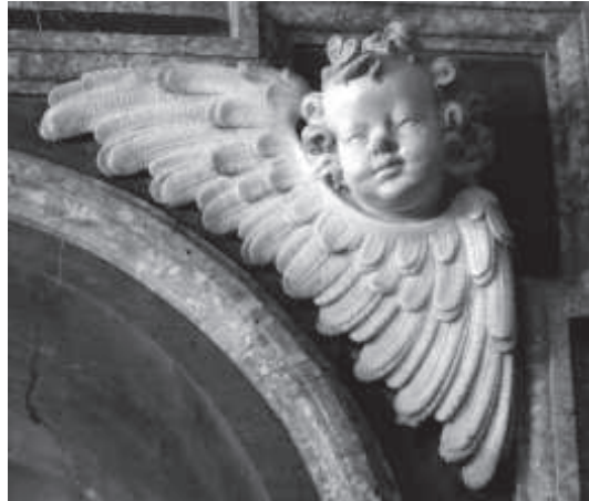
figura 10: Querubí d'un dels carcanyols dels nínxols de la capella de la Cinta de la catedral de Tortosa, compareu-lo amb la figura següent.