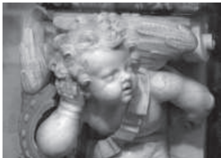
figura 11: Angelet del Sagrari de la catedral de Tarragona, obra documentada d'Isidre Espinalt, compareu-lo amb la figura anterior.