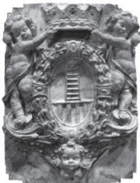
figura 1: Escut heràldic d'Escaladei, conservat al Museu de Tortosa.