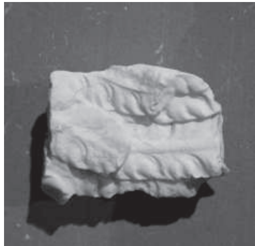
figura 12: Ales d'àngel, fragment trobat a les excavacions d'Escaladei.