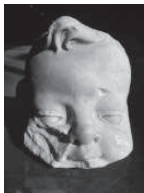
figura 4: Cap d'un angelet de la catedral de Tortosa localitzat recentment.