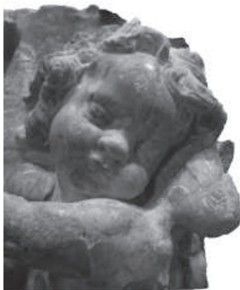
figura 2: Detall de l'escut amb un cap d'angelet.