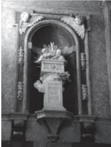
figura 9: Nínxol de la capella de la Cinta de la catedral de Tortosa amb la representació simbòlica de l'Arca de la Fe.